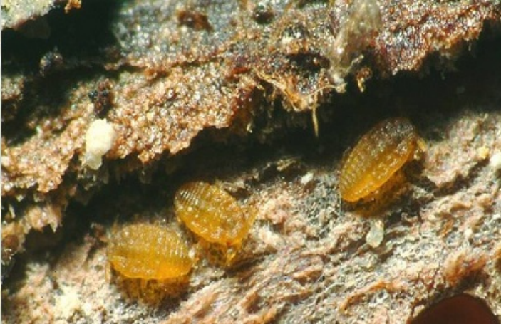
Galle prodotte da Fillossera