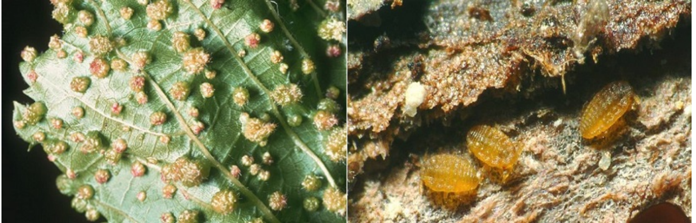
Galle prodotte da Fillossera