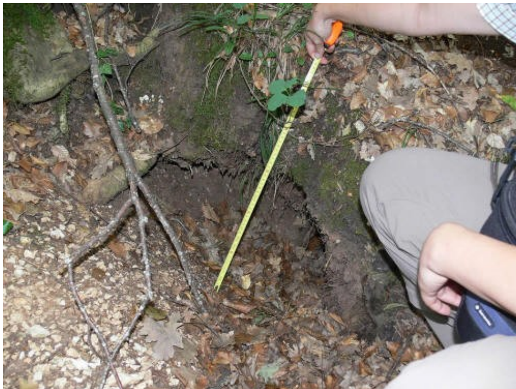
Foto 4 - Ingresso tana: il foro di ingresso delle tane di istrice può avere un diametro che varia dai 20 ai 60 cm, in quest'immagine è di circa 30 cm