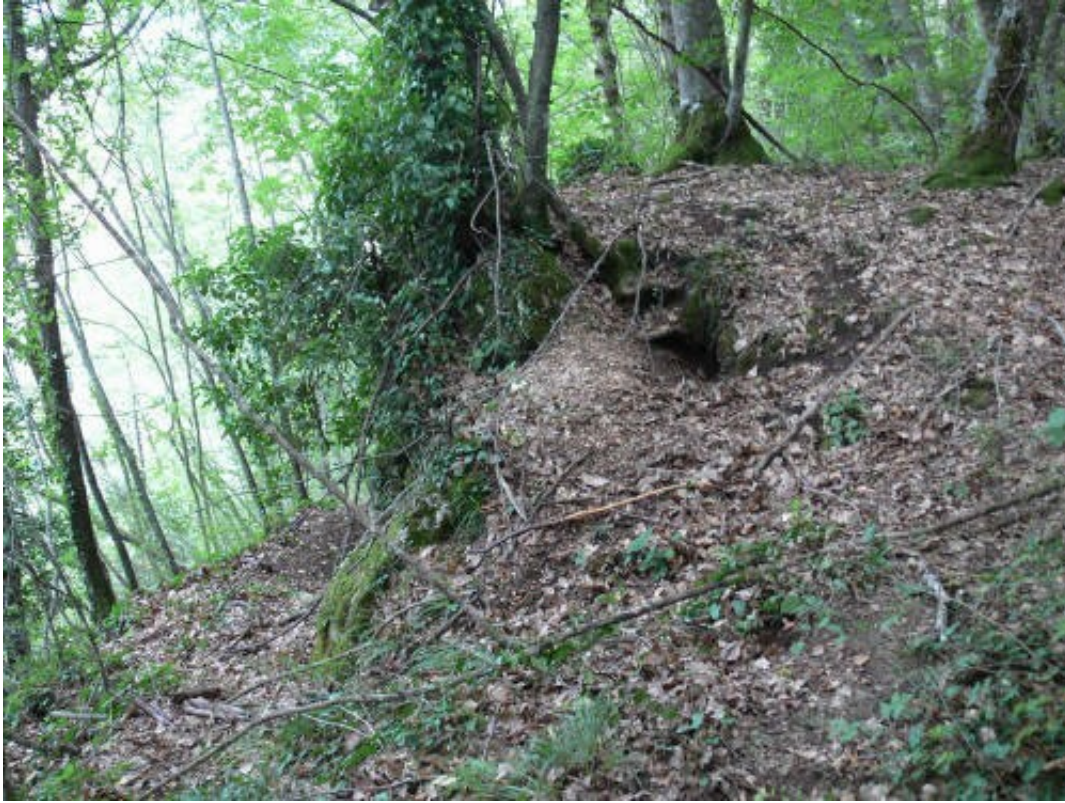
Foto 3 - Tana di Istrice costruita in una faggeta a partire da una cavità naturale