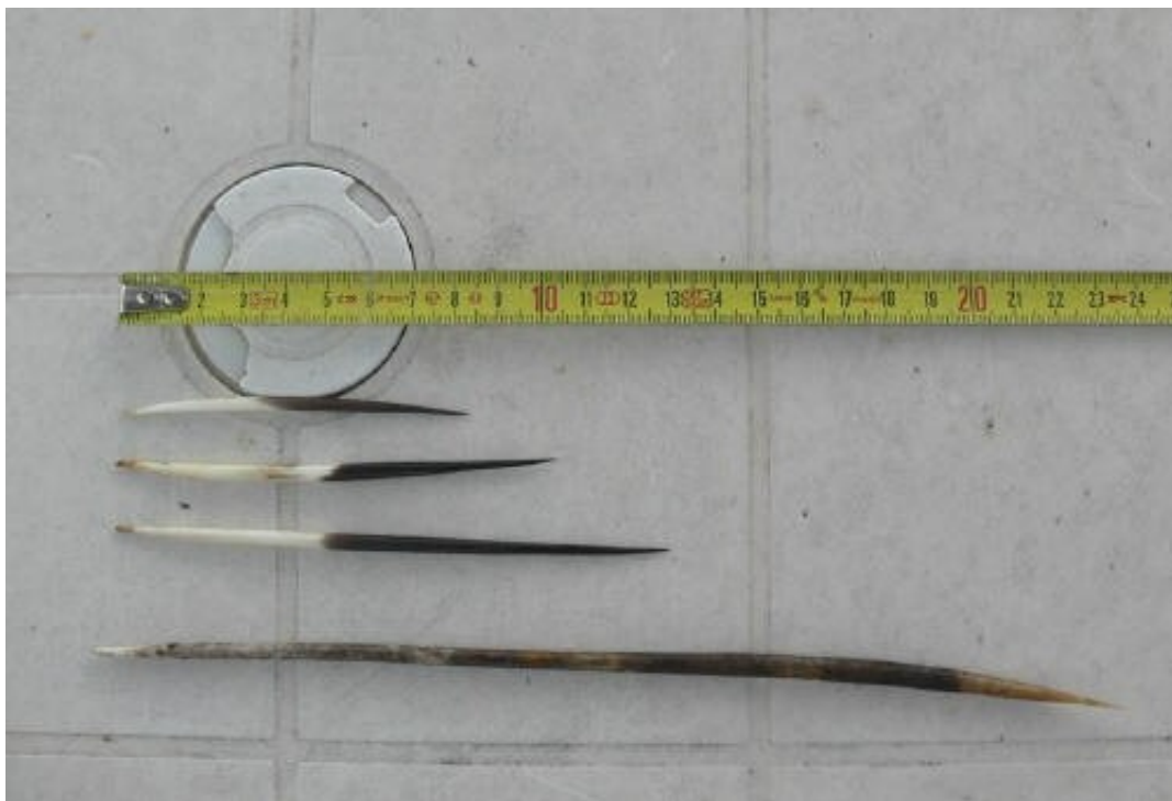
Foto 1 e 2 - Gli aculei di istrice possono arrivare a 40 cm di lunghezza