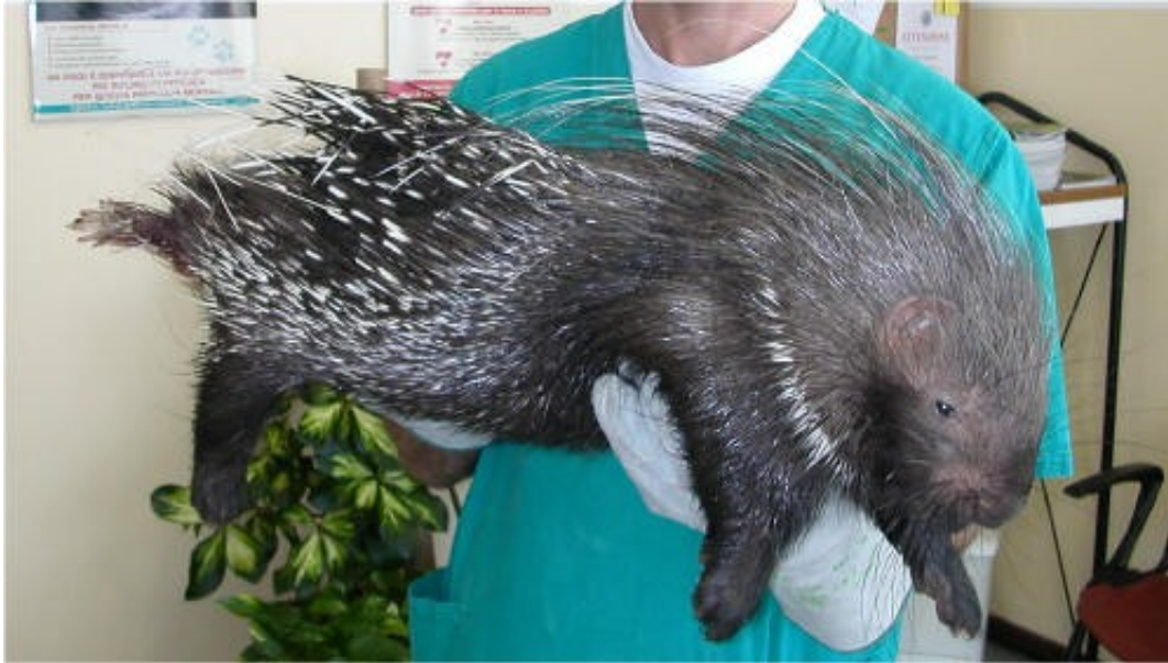
Giovane istrice ritrovata in Provincia di Verona