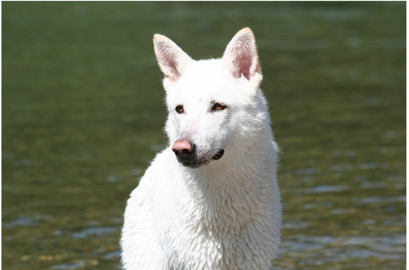
"Auri Luna", un tipico Saarloos bianco

Non sono mai stato portato per le letture romanzate, per i romanzi fantasy, che oggi vanno molto di moda o per i testi letterali che fungono da cronaca o da lezione psicologica applicata alla nostra vita; queste letture non fanno per me. Anche se non posso che ammirare coloro che si cimentano in queste scritture, io preferisco attenermi a quel che sono e alla sostanza della mia formazione e allo stesso tempo trattare nei miei scritti ciò che più amo e che più conosco, ossia la zootecnia; materia che racchiude svariati enigmi, infinite metodologie e innumerevoli eccezioni.