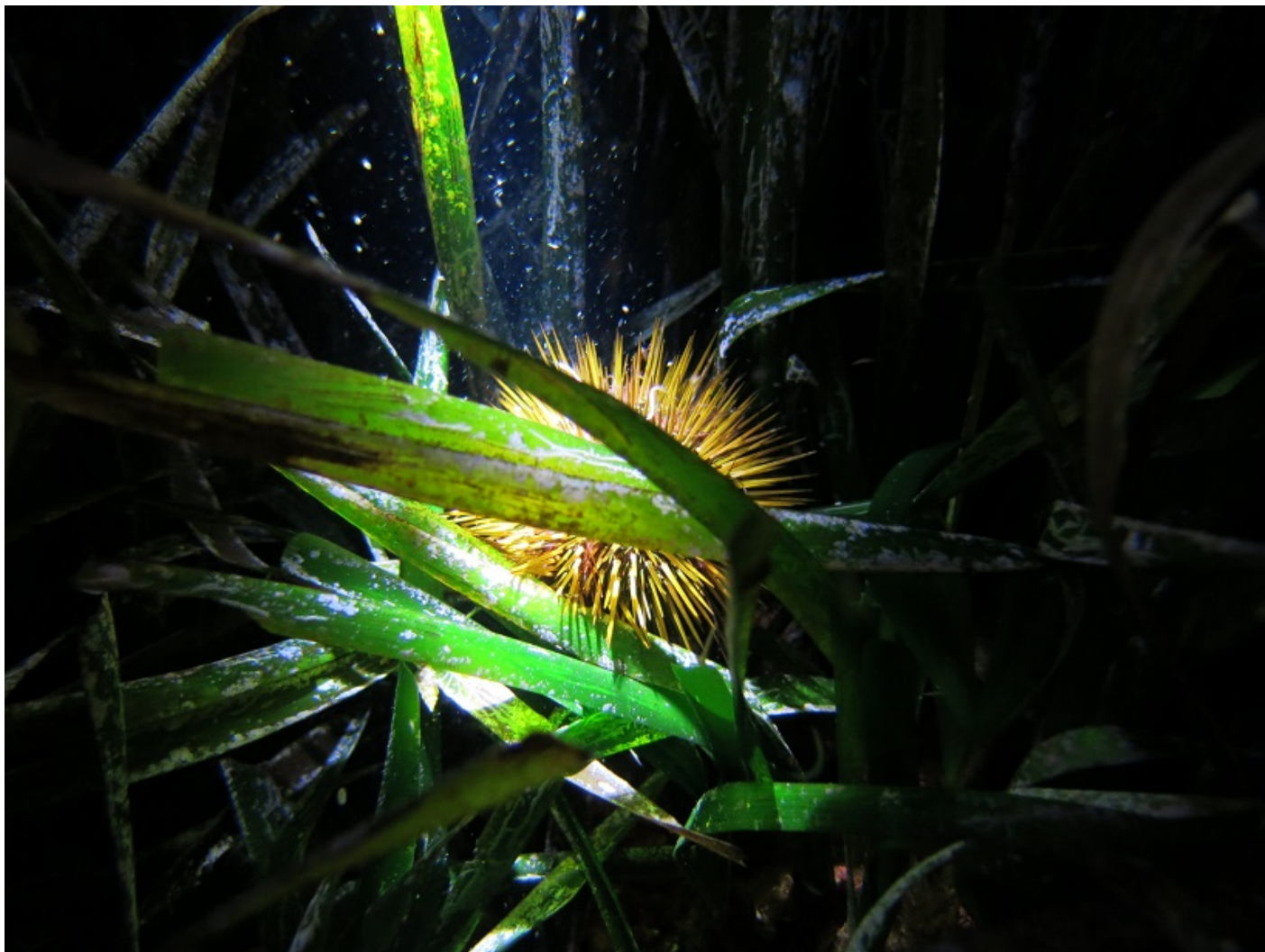
P. lividus su prateria di Posidonia oceanica

Come tutti gli Echinoidi P. lividus è una specie gonocorica, a sessi separati, e non presenta dimorfismo sessuale. L'apparato riproduttore è costituito da 5 gonadi sospese nella faccia interna della teca, di colore rosso brillante-arancio acceso nelle femmine, giallo-arancio chiaro nei maschi. A seconda della zona geografia e delle relative condizioni ambientali, la specie può avere uno o due eventi riproduttivi durante l'anno. Generalmente quello principale inizia in primavera (aprile-maggio) e si conclude nei mesi estivi (luglio-agosto), mentre quello secondario ha luogo durante la stagione autunnale.