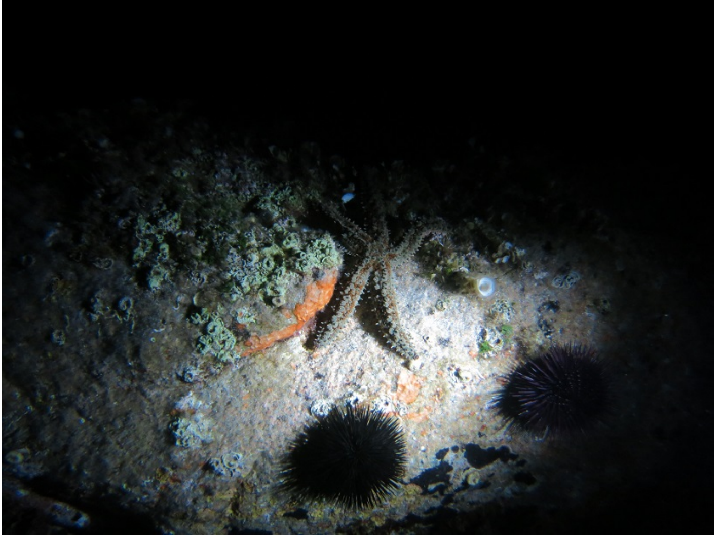
Ricci di mare su substrato roccioso