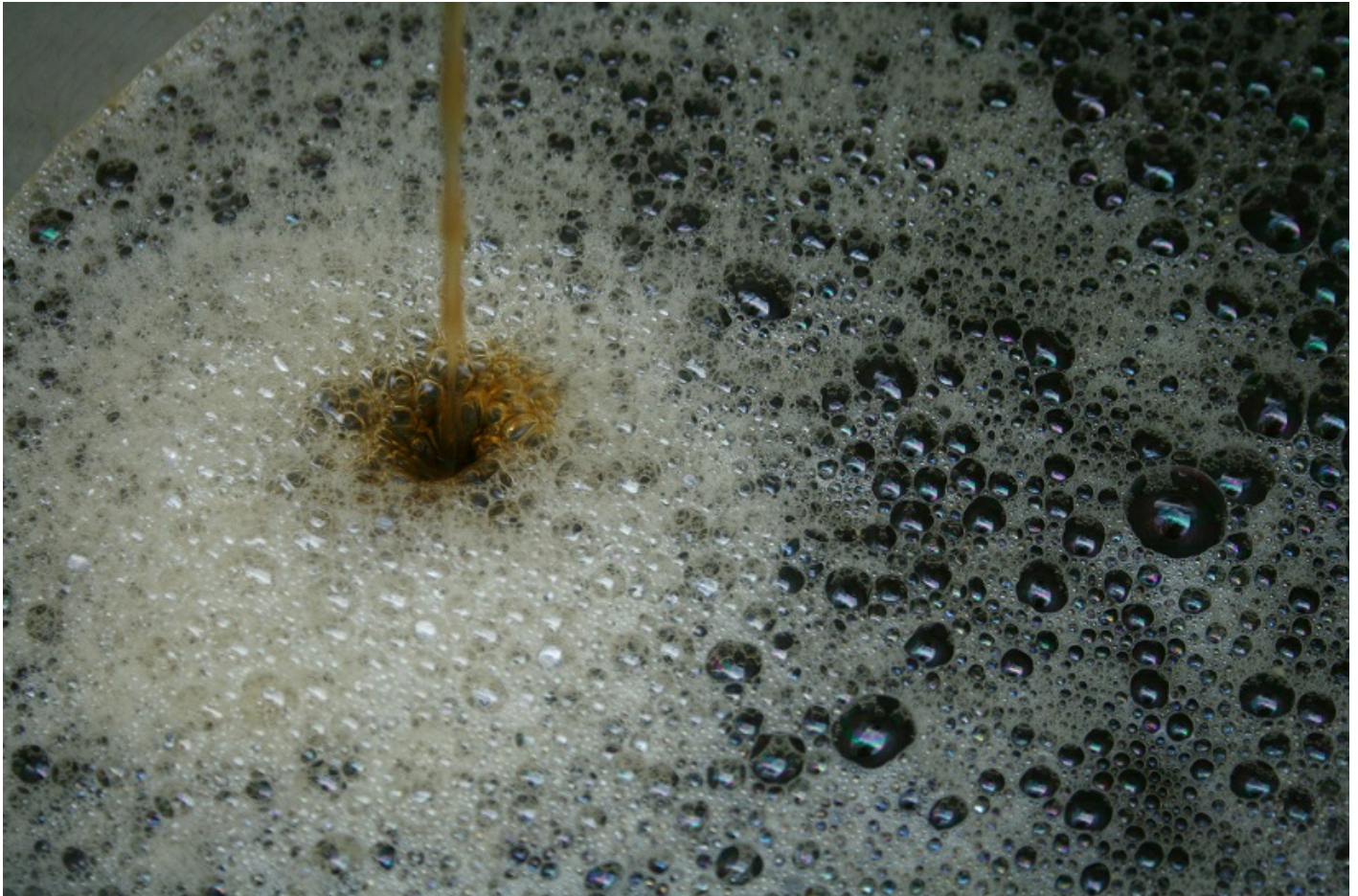
Mosto di birra

predilige temperature di processo comprese tra i 6 e i 12°C (per 10 – 15 giorni) e che quindi necessita di tini di fermentazione condizionati in grado di garantire il controllo della temperatura. I lieviti non galleggiano, ma si posizionano in basso, sul fondo del tino. Quella della bassa fermentazione è l'ultima tecnologia brassicola adottata in ordine di tempo, proprio perchè legata alla necessità di poter controllare la temperatura di processo mediante impianti di raffreddamento della massa (ricordiamo che la reazione che trasforma lo zucchero in alcol e anidride carbonica è esotermica, cioè produce calore).