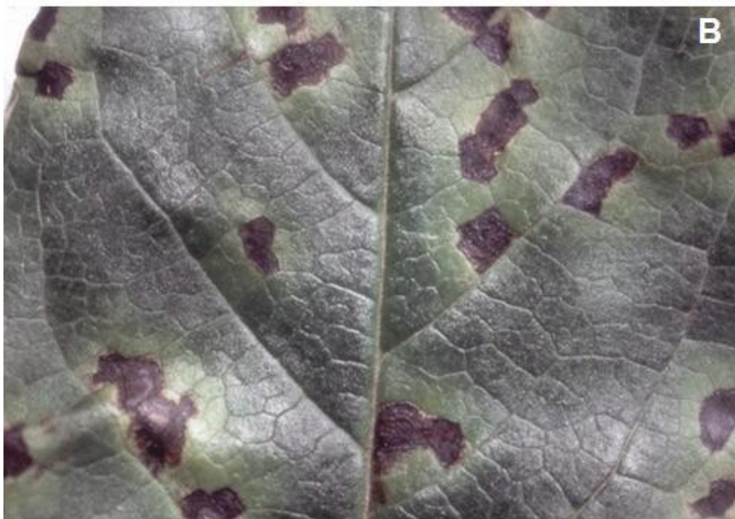
Fig. 2a – Tipiche maculature angolari su foglie causate da infezioni batteriche ( A, B ). Stato idropico ( A ) e necrotico ( B ).