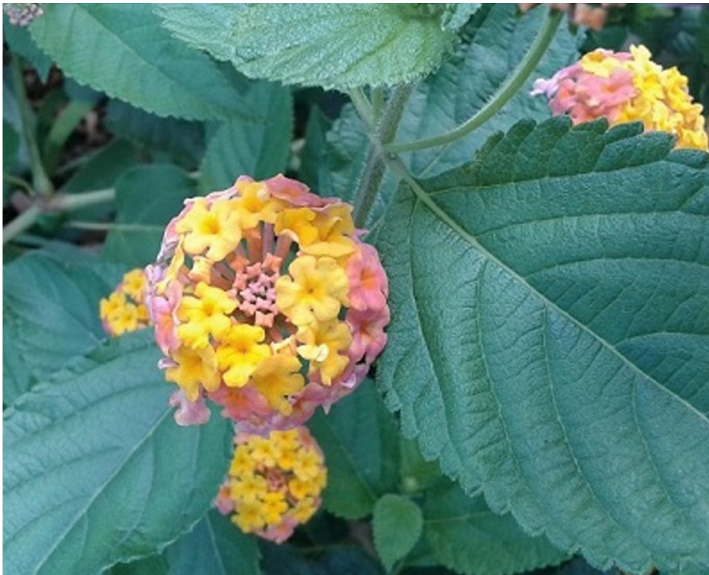
Figura 3. Anche la lantana ( Lantana camara L.), specie esotica ma ormai molto comune in Italia, è in grado di produrre composti allelopatici