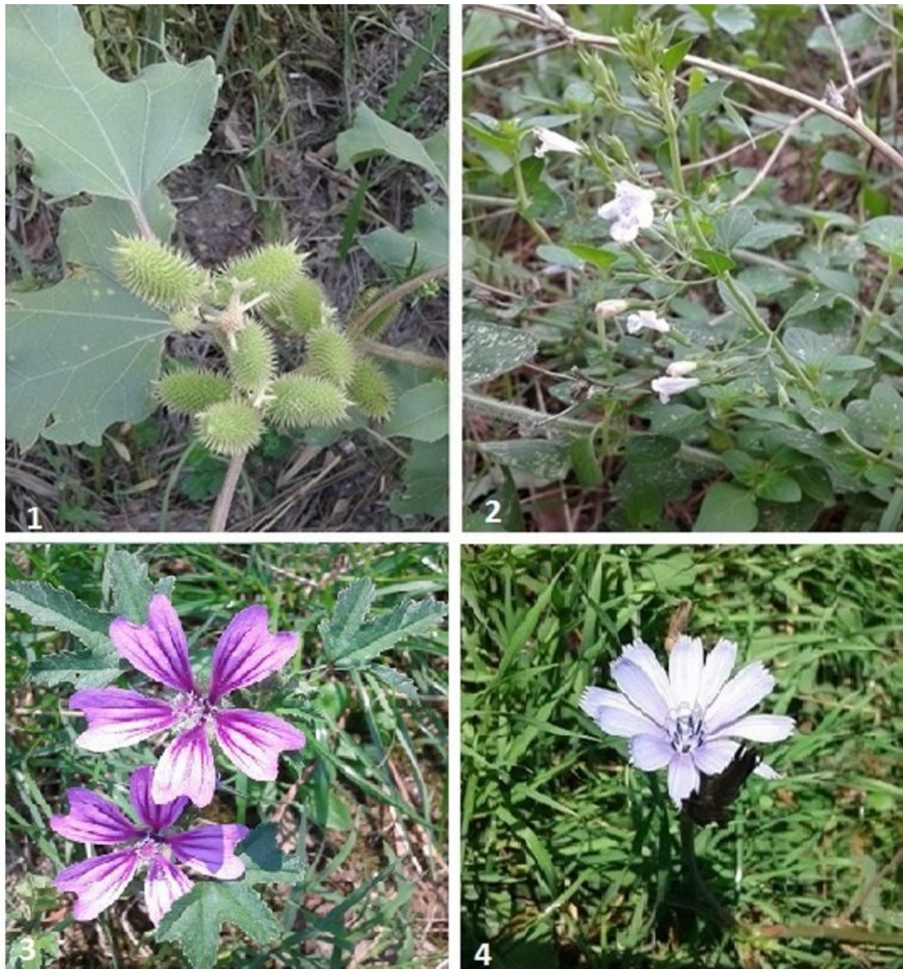
Figura 2. La nappola (1) ( Xanthium strumarium L.), la mentuccia comune (2) ( Clinopodium nepeta L. Kuntze), la malva selvatica (3) ( Malva sylvestris L.) e la cicoria (4) ( Cichorium intybus L.), specie molto comuni in ambienti mediterranei, hanno dimostrato possedere attività fitotossiche.