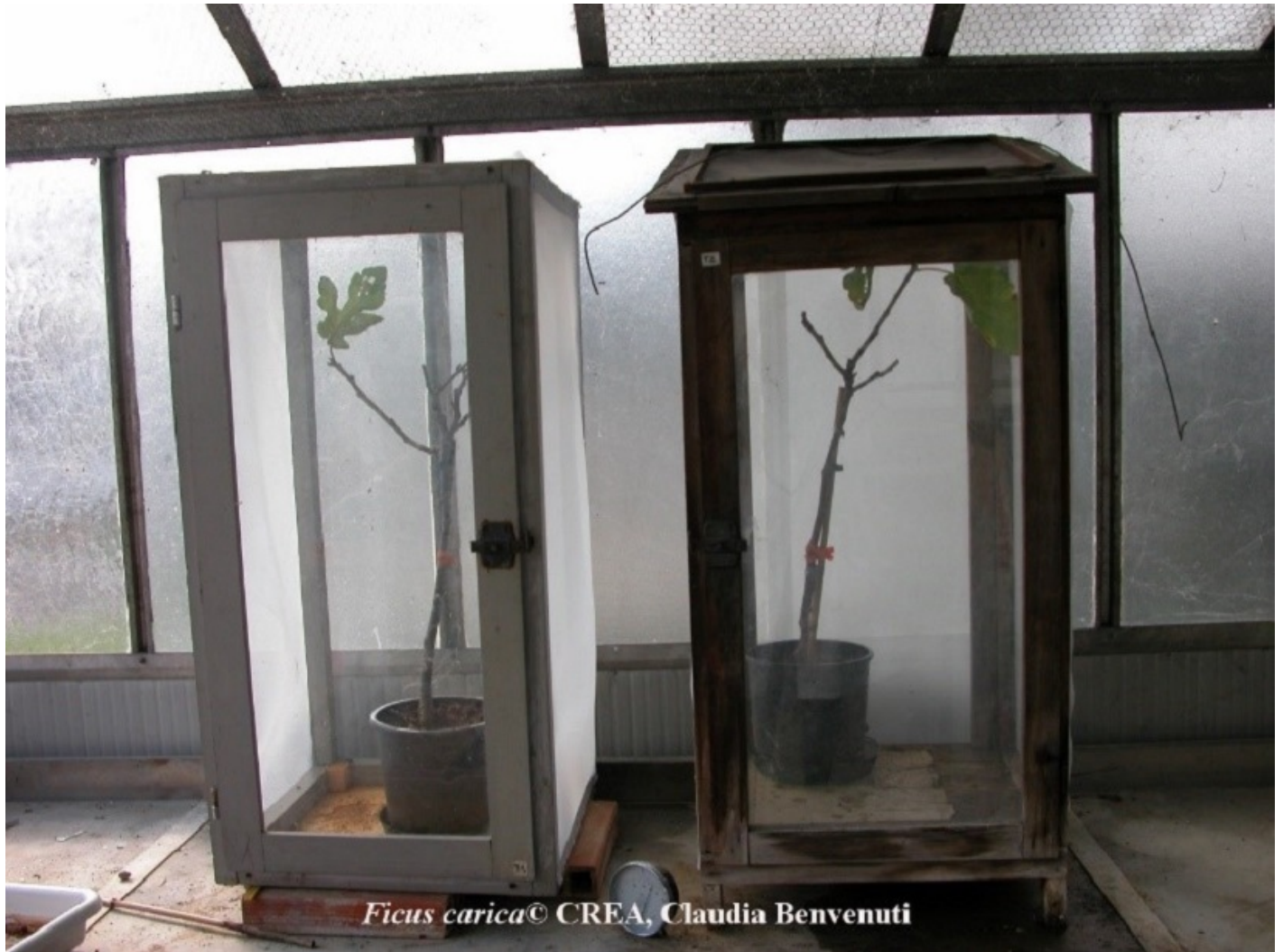
Fig. 6 – Gabbie entomologiche per sperimentazione

I controlli sono stati effettuati una volta alla settimana fino a 35 giorni dal trattamento e quindi è stata calcolata la mortalità degli adulti di Aclees a distanza dai vari giorni dal trattamento. Gli individui morti venivano poi prelevati e sterilizzati con ipoclorito di sodio all'1%, successivamente risciacquati tre volte con acqua distillata sterile, e poi messi in piastre Petri su carta da filtro inumidita e mantenuti a 25 \pm 1 ° C per verificare la presenza di sporulazione del fungo e verificare così che la mortalità degli adulti fosse dovuta al trattamento (Grafico 1).