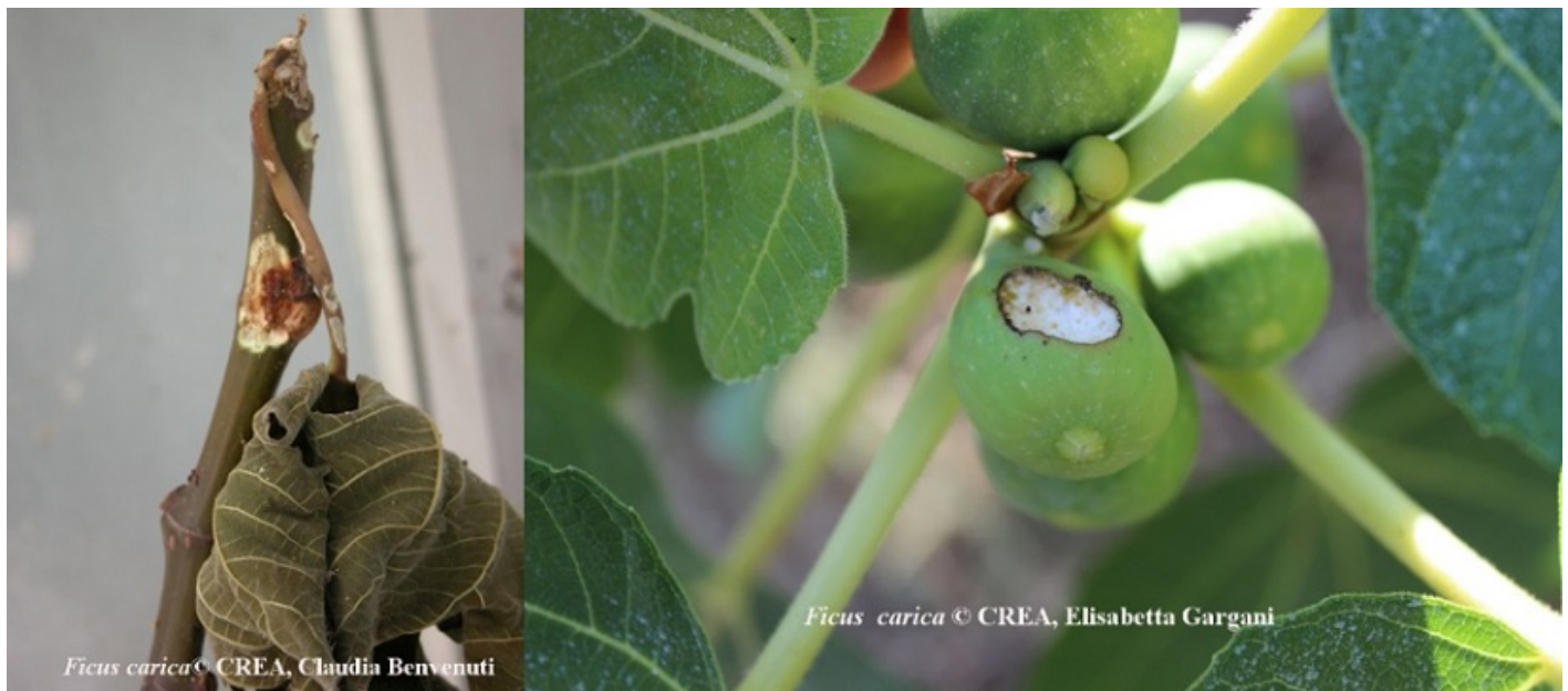
Fig. 5 - Rametto e frutto danneggiati dall'attività trofica dell'adulto di A.cf sp foveatus

Gli adulti possono volare, anche se sulla pianta si spostano generalmente camminando e lasciandosi cadere se disturbati; si alimentano a carico di frutticini in accrescimento ma anche di giovani rametti (Fig. 5). Nelle nostre aree si possono osservare due picchi di presenza degli adulti in attività sulla pianta, uno a partire da giugno e l'altro a settembre (Ciampolini et al., 2007). Le nostre osservazioni in campo sono state effettuate da luglio a ottobre 2015, in diverse aree regionali, in particolar modo nella zona di produzione del "Fico secco di Carmignano" (Prato), dove sono state rilevate molte piante sintomatiche. I sopralluoghi si sono poi allargati ad altre zone della Toscana, dove si è avuto così modo di verificare la diffusione della specie nelle province di Pistoia, Lucca, Prato, Firenze e Livorno (Isola d'Elba). Le larve e gli adulti raccolti durante i sopralluoghi in campo sono stati poi mantenuti in allevamento in condizioni controllate presso i laboratori del CREA ABP di Firenze, infatti sono ancora poco conosciute le caratteristiche bio-etologiche della specie.