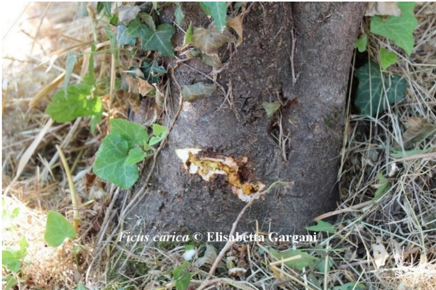
Fig. 2 - Galleria (aperta artificialmente) causata da larve di A. cf sp foveatus su fico adulto

L'insetto colpisce il fico inizialmente a livello del colletto/grosse radici, nella zona di contatto con il terreno (Fig. 2).