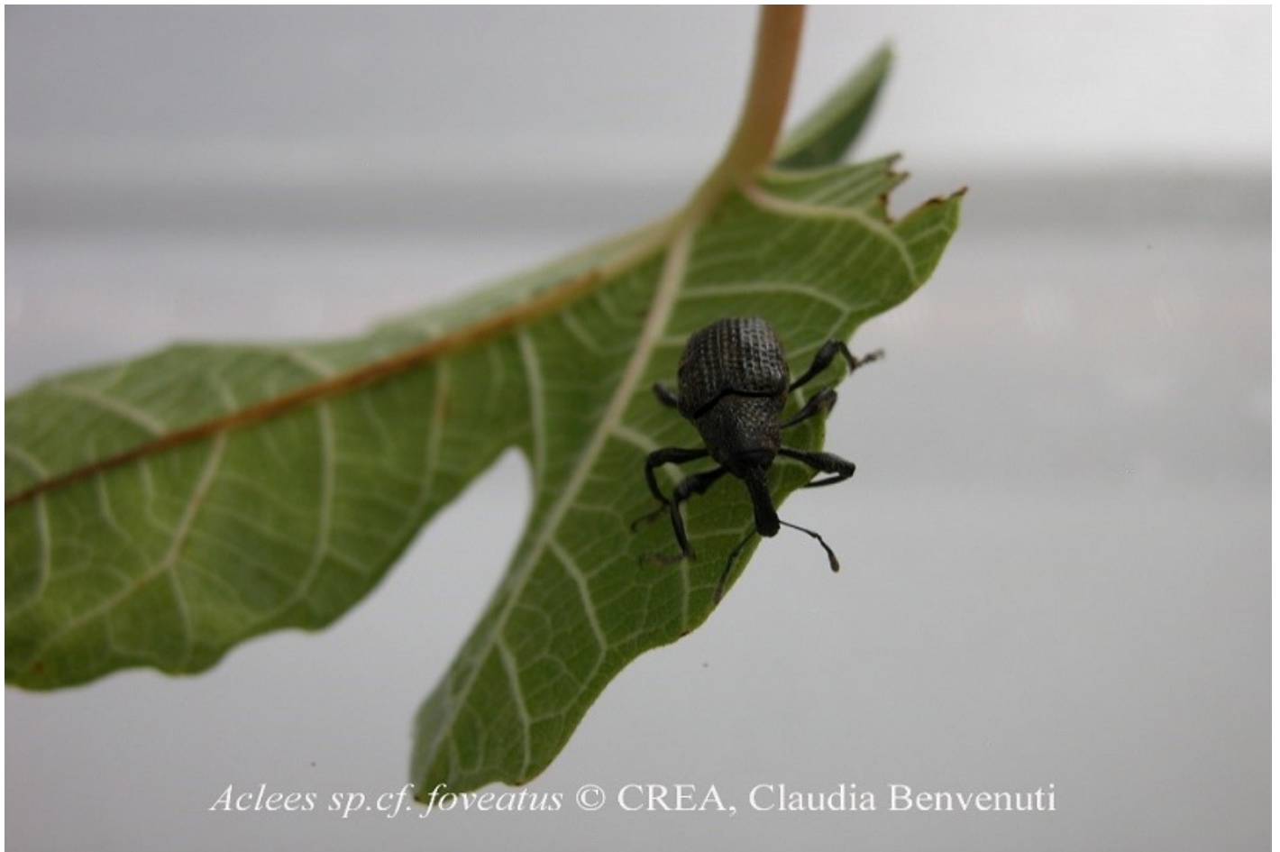
Fig. 1 - Aclees sp.cf. foveatus . Adulto su foglia di fico

Aclees sp.cf. foveatus (Benelli et al., 2014) è un coleottero curculionide arrivato dall'Asia forse 10-15 anni fa, presumibilmente tramite scambi commerciali (Fig. 1).