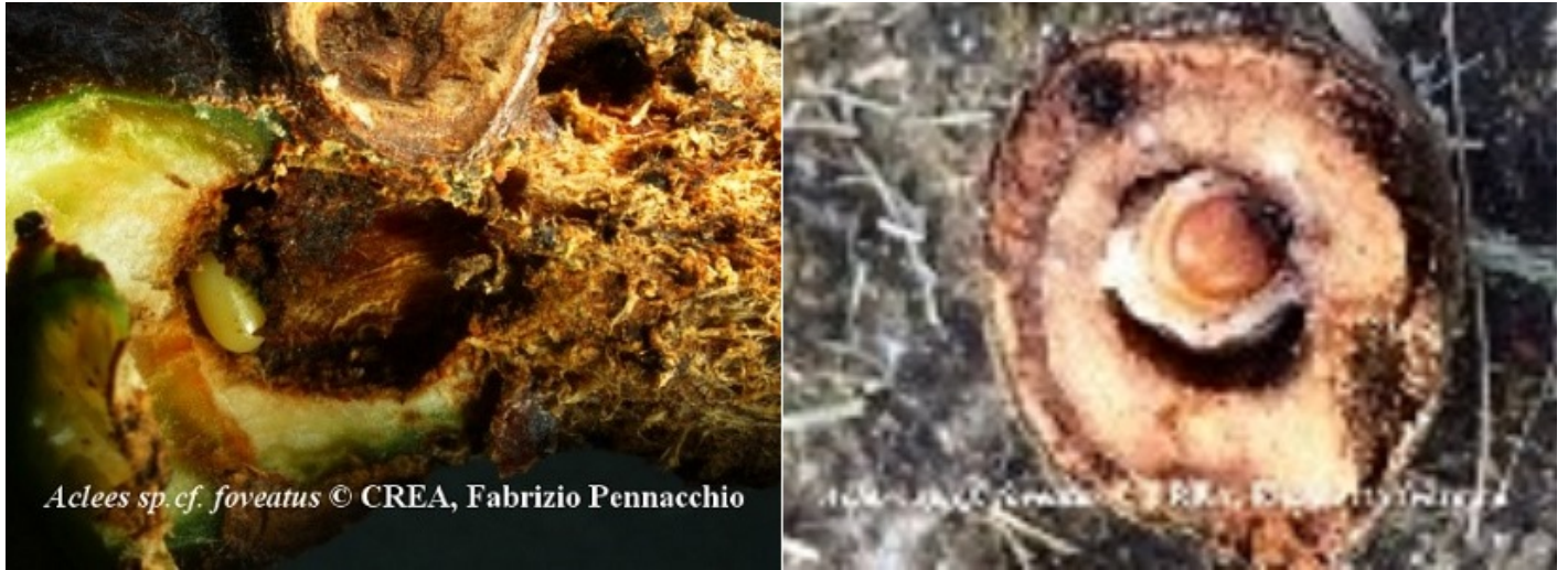
Fig. 3 - Uovo (sn) e larva matura (dx) di A. cf sp foveatus