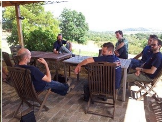
Maremma, giugno 2013