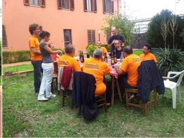
Firenze, settembre 2012