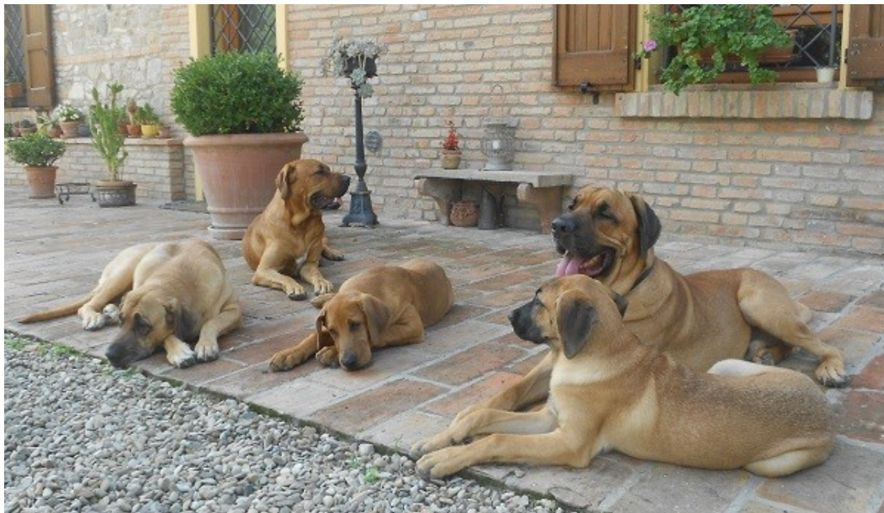
Baby Dana Flynn Yvarr Alfred Thyra Broholmer Italiani