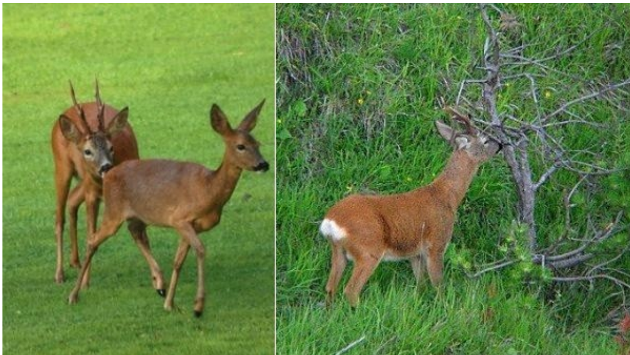
Maschio e femmina di capriolo - Maschio che marca il territorio

Particolarmente sviluppati risultano nel capriolo i sensi dell'olfatto e dell'udito. L'importanza di quest'ultimo è evidenziata dalla forma e dalle dimensioni delle orecchie, nonché dalla loro estrema mobilità (Sempéré et al., 1996; Tarello, 1991). L'olfatto ha un grande rilievo nell'ambito dei contatti e delle relazioni sociali, in particolar modo durante la fase territoriale e degli accoppiamenti. Nei maschi infatti la regione frontale è cosparsa di numerose ghiandole che in primavera-estate emettono una sostanza sebacea odorosa, che serve per marcare il territorio. Anche nella zona metatarsale e interdigitale di ambedue i sessi sono presenti ghiandole odorifere, attive tutto l'anno, le quali sembrano assumere funzione di richiamo "amoroso" nel primo caso e di riconoscimento individuale nel secondo (Sempéré et al., 1996; Liberg et al., 1998).