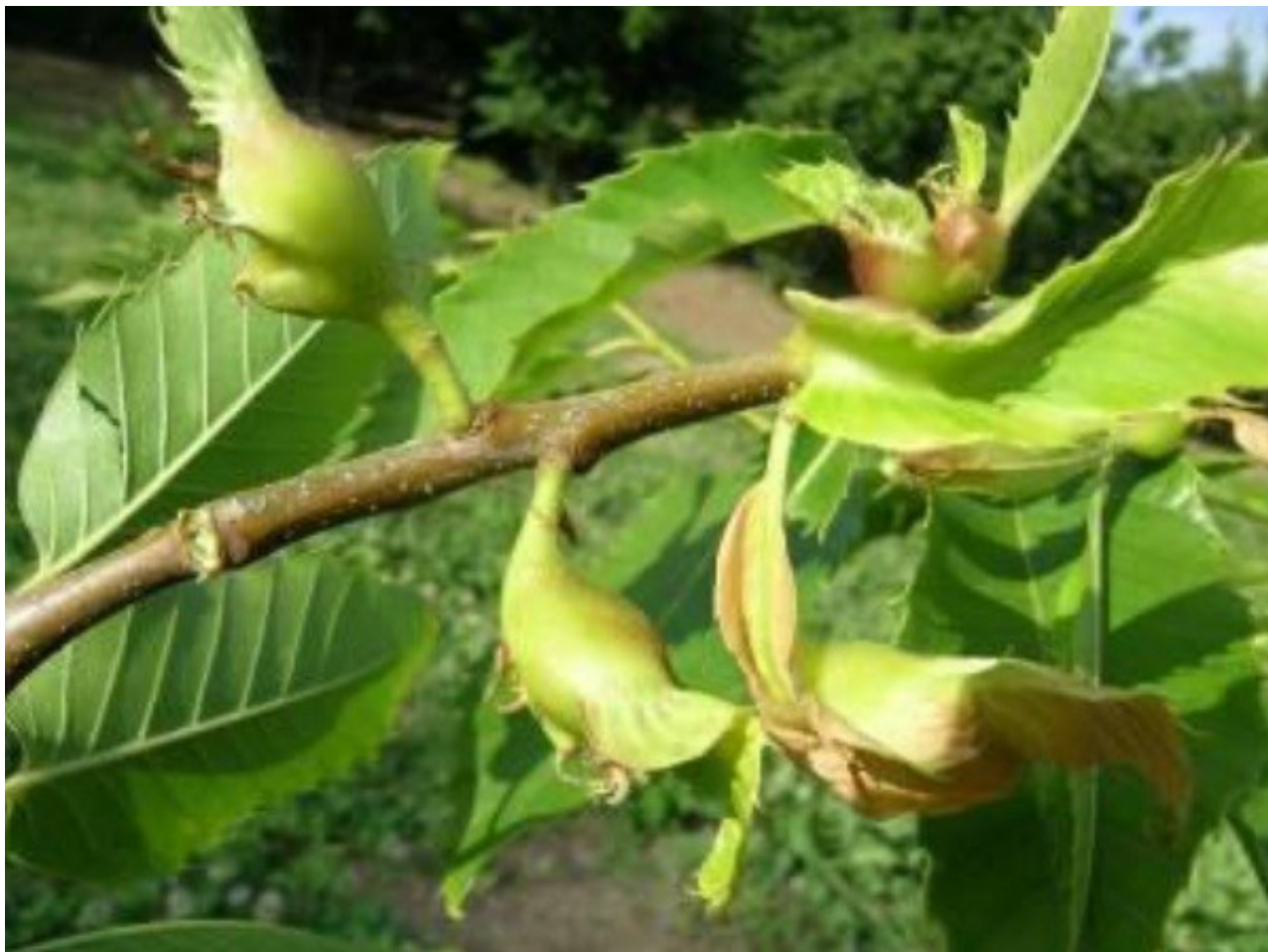
Fig. 3: Giovane rametto con galle

Il grave danno che consegue all'attacco è una diminuzione della crescita vegetativa e della produzione di frutto, con perdite che possono raggiungere il 60-80 % della produzione; le giovani piantine inoltre possono essere portate a morte.