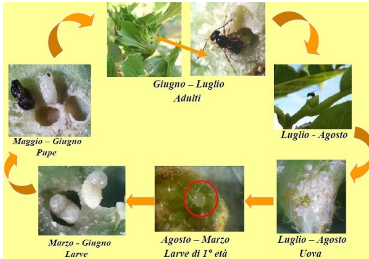
Fig. 2: Ciclo biologico di D. kuriphilus Yasumatsu nell'Italia Centrale

Le larve, avendo uno sviluppo lento, costituiscono la forma svernante, questa infestazione è tuttavia asintomatica fino alla primavera successiva, quando invece gli organi colpiti si trasformeranno in galle, di diametro variabile da 0,5 a 2 cm. Queste, a seconda delle dimensioni, possono ospitare da 1 a 7-8 cellette al cui interno si sviluppa la larva e i successivi stadi larvali. Le larve sono di colore bianco, apode e anoftalme. Sempre nelle galle si formano le pupae, da cui sfarfalleranno le femmine adulte. Le galle sui germogli disseccano nel corso dell'estate e dell'autunno rimanendo visibili fino all'anno successivo.