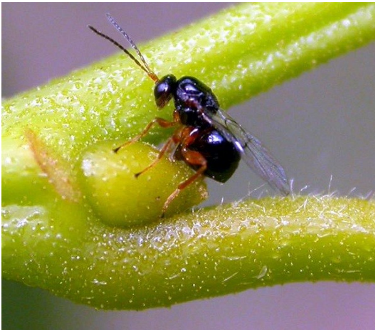
Fig. 1: femmina ovideponente di D. kuriphilus

Questo insetto è considerato a livello mondiale tra i più dannosi per il castagno. La specie, originaria della Cina e in precedenza assente in Europa, è stata introdotta accidentalmente nel corso del Novecento in Giappone (1941), Corea (1963) e Stati Uniti (Georgia, 1974), provocando gravi danni alla castanicoltura (G. Bosio, 2004).