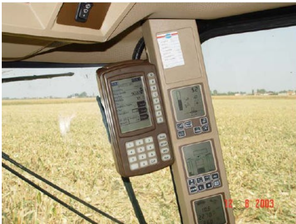
Figura 1: Dispositivo GPS installato sopra una mietitrebbia

L'agricoltura di precisione è stata ideata negli Stati Uniti ed in Canada. La forza che ha favorito lo sviluppo di questa metodologia di gestione delle produzioni agrarie è stata fornita dalle compagnie di servizio: i grandi contoterzisti distributori di fertilizzanti e di agrochimici. In particolare nel Mid West dove il ricorso ai contoterzisti per queste operazioni coinvolge pressoché la totalità delle superfici, il fornire la mappatura dei terreni e quindi informazioni all'agricoltore è diventato uno strumento di concorrenza. La mappatura del terreno (Figura 2) permette, infatti, all'agricoltore di avere un aumento di produzione e una riduzione dell'impiego dei principi attivi. In Germania e nel Regno Unito, che sono i due Paesi europei con il maggior numero di applicazioni, l'agricoltura di precisione è vista come uno strumento per l'ottimizzazione dei fattori di produzione e quindi del reddito. Le aziende che adottano questi sistemi sono di dimensioni decisamente superiore alla media europea, adibite a colture estensive e devono reggere il confronto con i prezzi a livello mondiale.