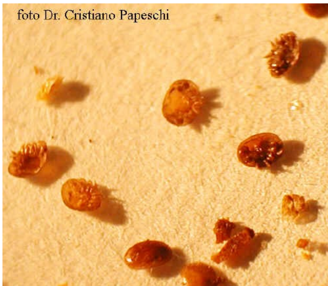
Foto 2 - Varroa destructor fotografata a piccolo ingrandimento

pupe e la membrana intersegmentale delle api adulte. La femmina è molto veloce nei movimenti e vive fino a 3 mesi, tempo entro il quale può compiere fino a 2-3 accoppiamenti.