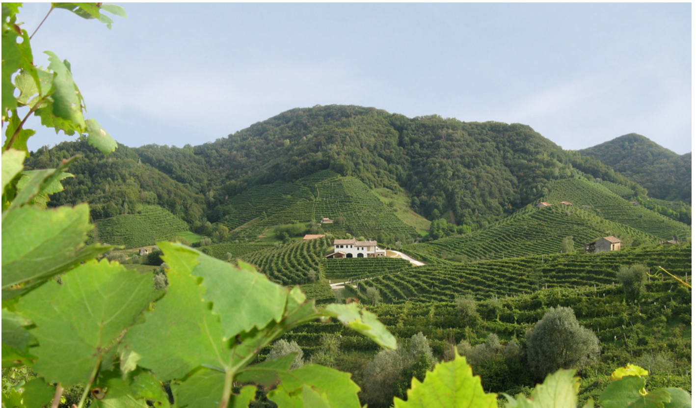
Vigneti Prosecco DOCG

“Per un problema complesso non esistono soluzioni semplici - ha raccontato Moro – ma possiamo assicurare che quest'area si sta dotando di provvedimenti validi ed efficaci al fine di garantire un'agricoltura sostenibile e un controllo dell'impatto delle coltivazioni sull'ambiente”.