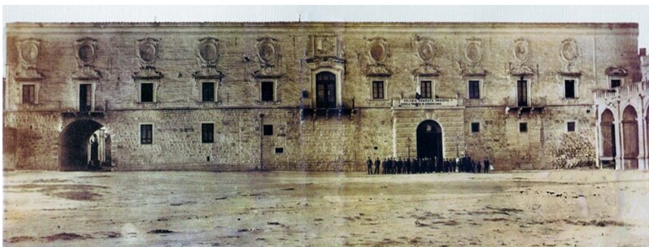
Panoramica d'insieme della Colonia Agricola - Scuola Pratica di Agricoltura, inizi Novecento

L'Istituto Tecnico Agrario "Umberto I" è dotato di un'azienda agraria che si estende per una superficie di circa 5 ettari. All'interno dell'azienda è presente anche una serra destinata alle produzioni florovivaistiche ed orticole. Le operazioni colturali sono eseguite dal personale dell'azienda con attrezzature e mezzi presenti nella struttura, in collaborazione con gli studenti i quali partecipano attivamente anche nella raccolta e trasformazione dei prodotti. Tutto quanto prodotto viene posto in vendita presso il punto vendita posto nello storico edificio scolastico ed aperto anche al pubblico (frutti e verdure stagionali, olio extravergine d'oliva, vini, birre artigianali, vincotto d'uva).