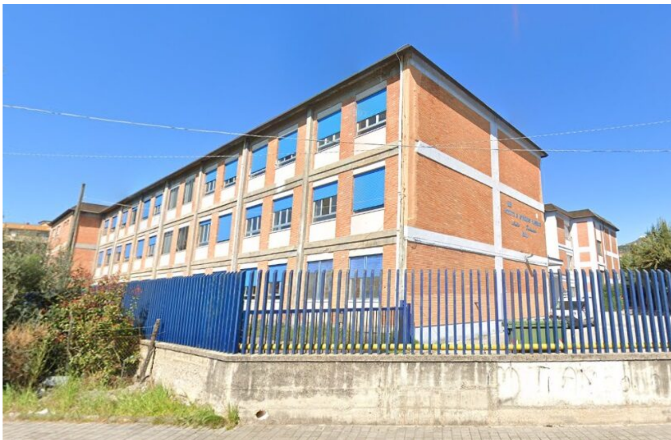
IIS "Mattei Fortunato" Eboli

written by Rivista di Agraria.org | 15 febbraio 2024