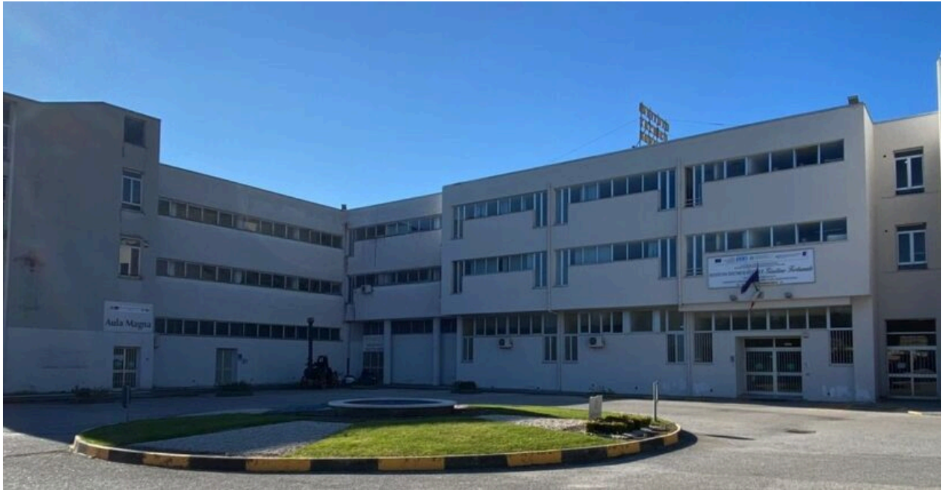
Sede dell'Istituto Agrario "G. Fortunato" di Eboli