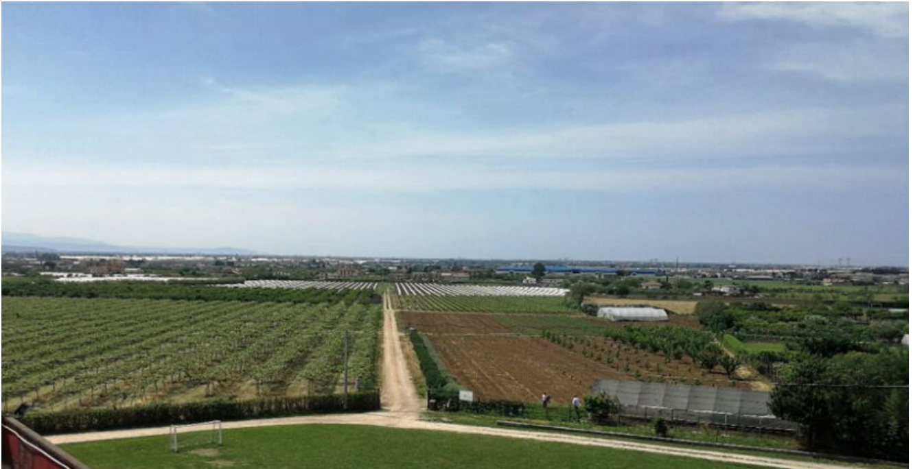
Veduta dell'azienda agraria