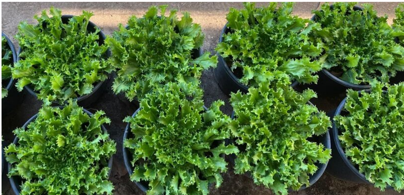
Figura 1. Cichorium Endivia var. latifolium. Trapianto in vaso ad inizio Novembre, raccolta a fine Gennaio.

written by Rivista di Agraria.org | 3 novembre 2024 di Ilenia Bravo