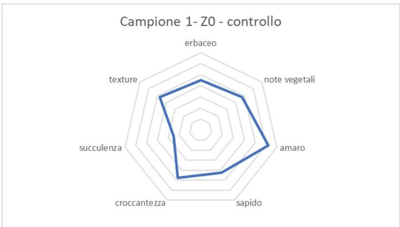
Fig.3. Profilo sensoriale del campione di controllo

Per quanto riguarda invece l'analisi organolettica, emerge che i campioni trattati con Magnesio, risultano avere caratteristiche di amaro, tipiche per l'Indivia scarola, meno pronunciate rispetto ai campioni di controllo, riscontrando anche dei gradimenti sensoriali superiori (Fig. 3,4).