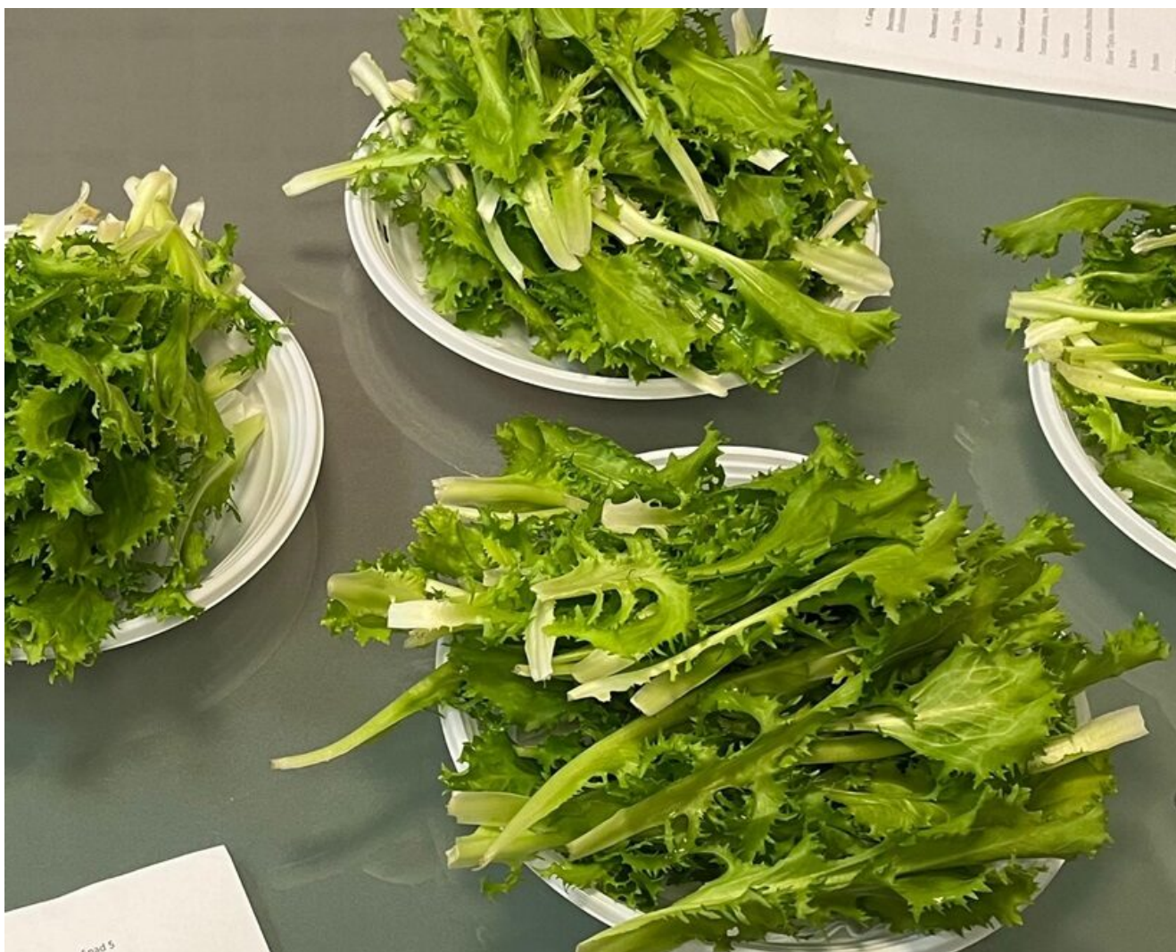
Figura 2. Preparazione dei campioni per l'analisi organolettica.

I campioni sono stati quindi selezionati per l'analisi del panel di assaggiatori professionisti, nella sala di degustazione del LAMeT. È stato costruito ad hoc un modello di profilo sensoriale, basato sulle caratteristiche di colture simili identificate in letteratura.