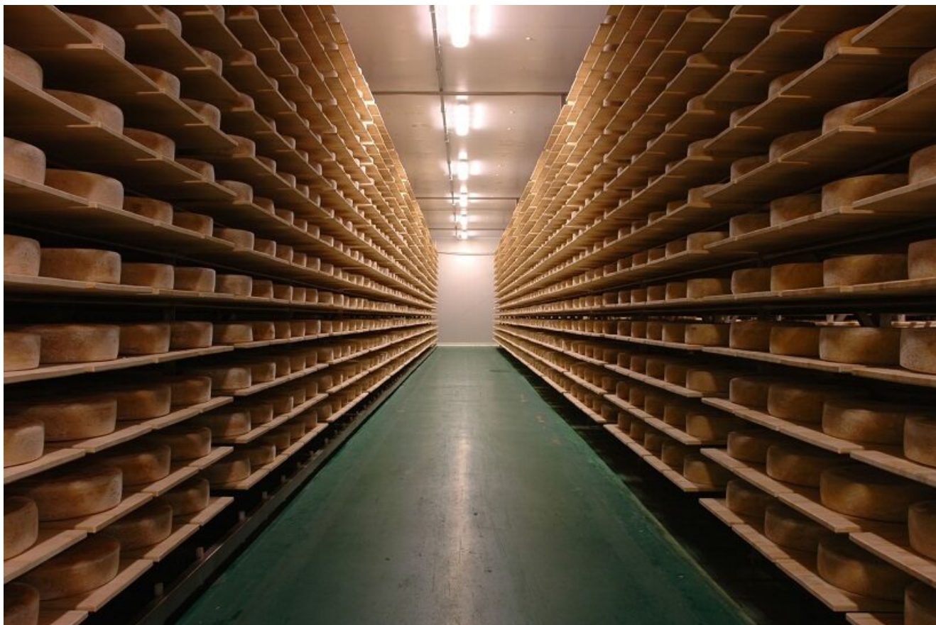
Scaffali per la stagionatura della Spresada delle Giudicarie Dop

written by Rivista di Agraria.org | 1 ottobre 2023 di Gennaro Pisciotta