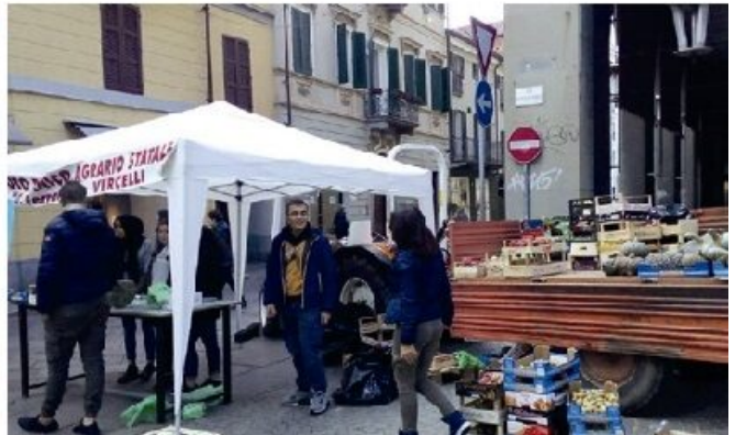
Istituto Tecnico Agrario "Galileo Ferraris" - Vercelli