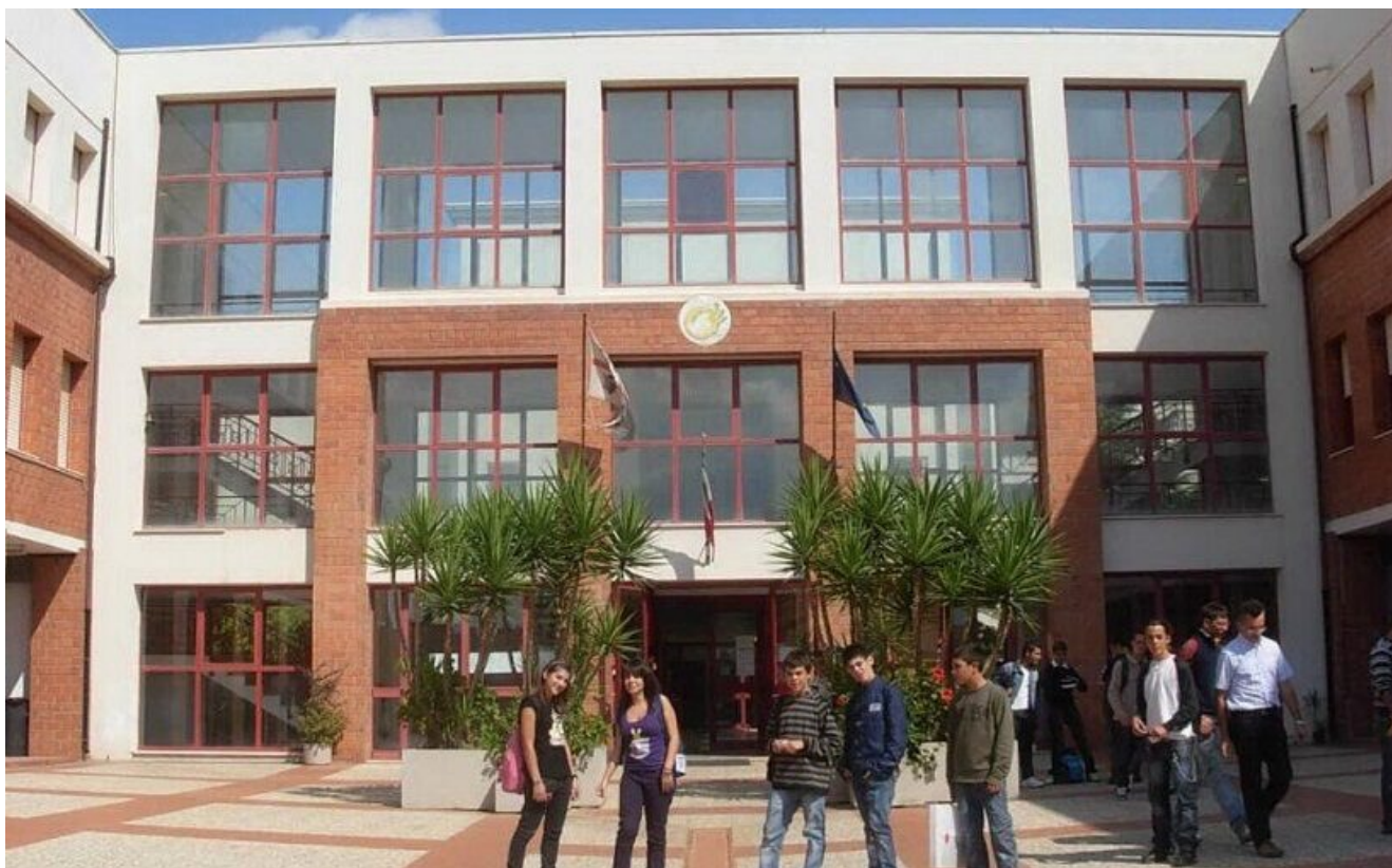
Istituto Tecnico Agrario “Duca degli Abruzzi”

written by Rivista di Agraria.org | 28 febbraio 2023