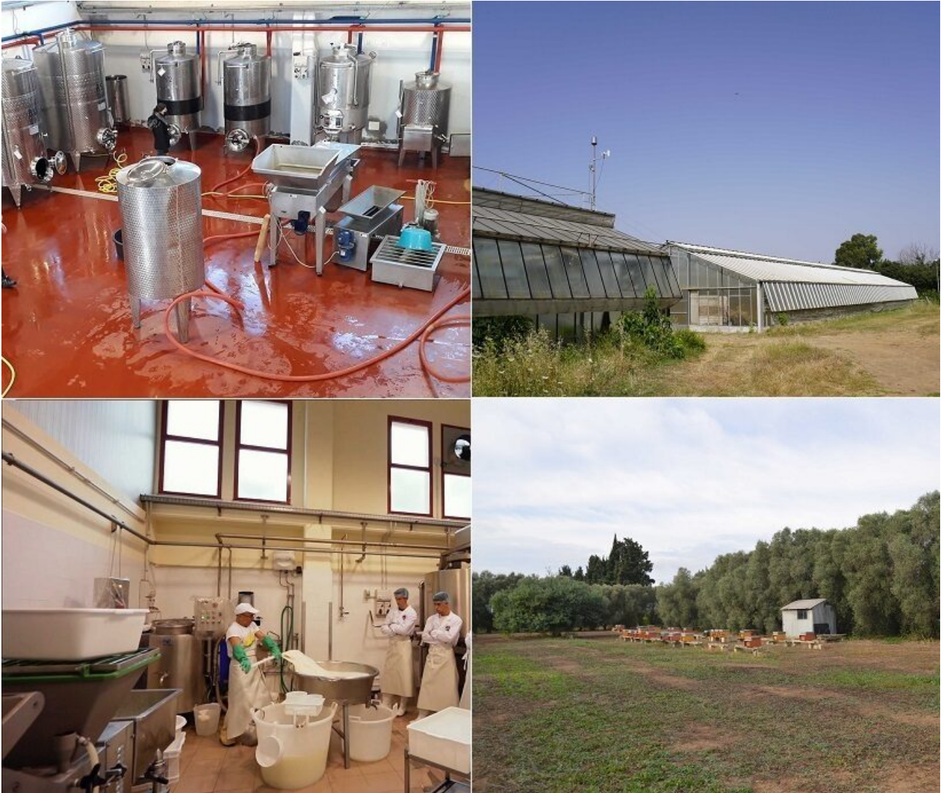
Cantina, caseificio, serre e apiario dell'Istituto Tecnico Agrario "Duca degli Abruzzi"