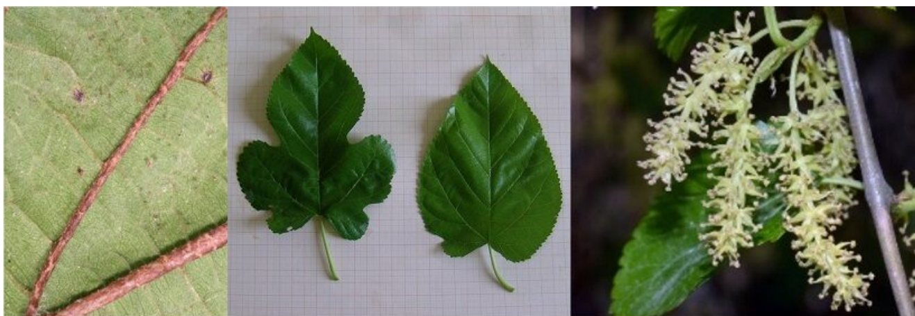
Foglia di M. alba

Il clima adatto per il Morus alba L. è quello temperato proprio dell'Italia Settentrionale, con minore intensità nella centrale ed assai poco nella meridionale; teme le brinate (N.d.R. Che possono arrecare vari danni) e non trova, quindi, condizioni favorevoli nelle giaciture basse e umide, in quando le condizioni pedologiche da preferire sono un suolo permeabile, soffice, non troppo argilloso, fresco ma non soggetto a umidità stagnante che possono anche favorire lo sviluppo di alcune malattie fungine.