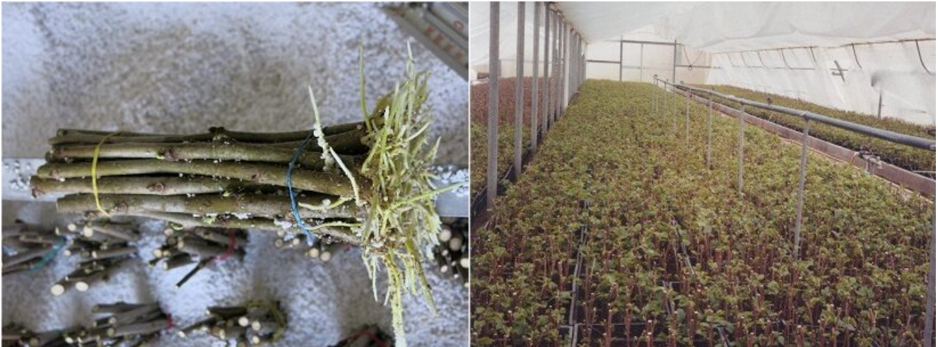
Talee di gelso e radicazione delle stesse su bancale riscaldato (Tratte da “la coltivazione del gelso” - Alessio Saviane, CREA-AA - Corso Veneto Agricoltura 2020)