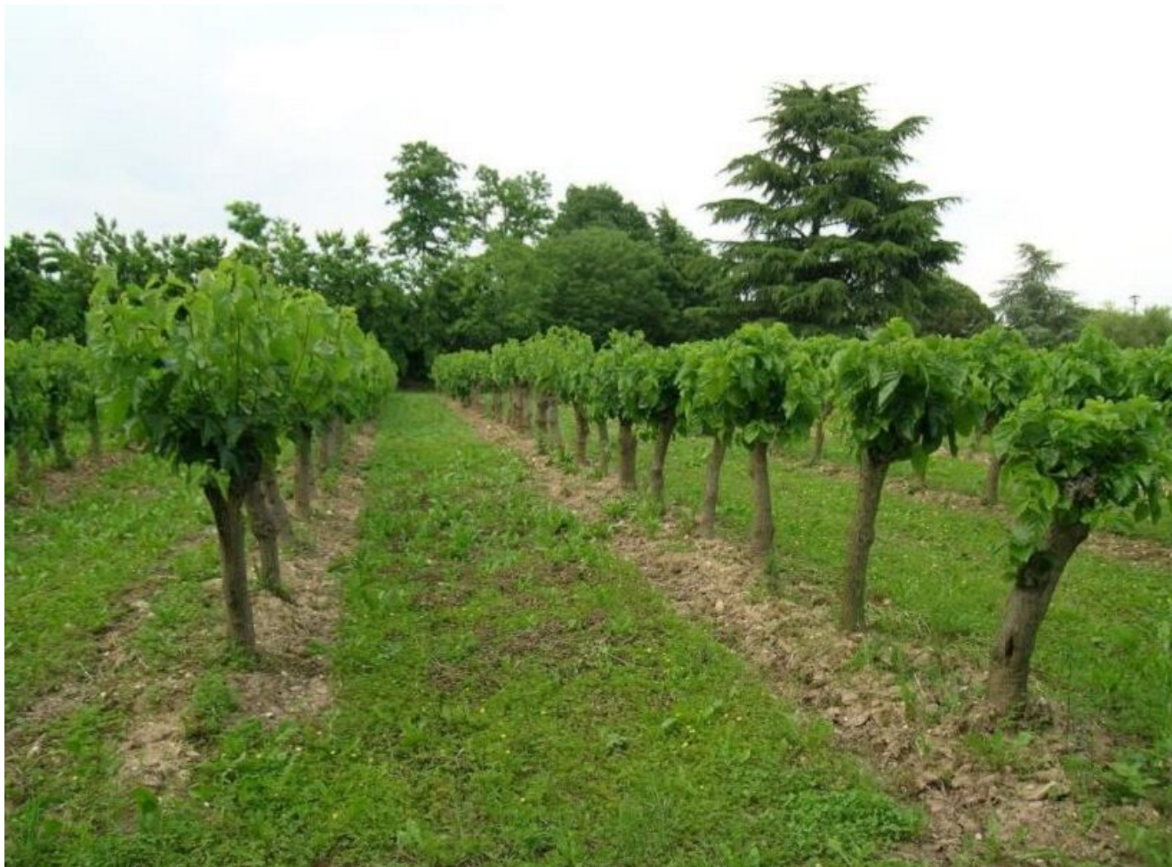
Giovane gelseto (Tratte da la coltivazione del gelso Alessio Saviane, CREA-AA - Corso Veneto Agricoltura 2020)

written by Rivista di Agraria.org | 1 gennaio 2022 di Gennaro Pisciotta