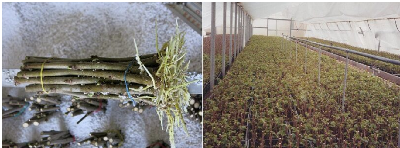
Talee di gelso e radicazione delle stesse su bancale riscaldato (Tratte da “la coltivazione del gelso” - Alessio Saviane, CREA-AA - Corso Veneto Agricoltura 2020)