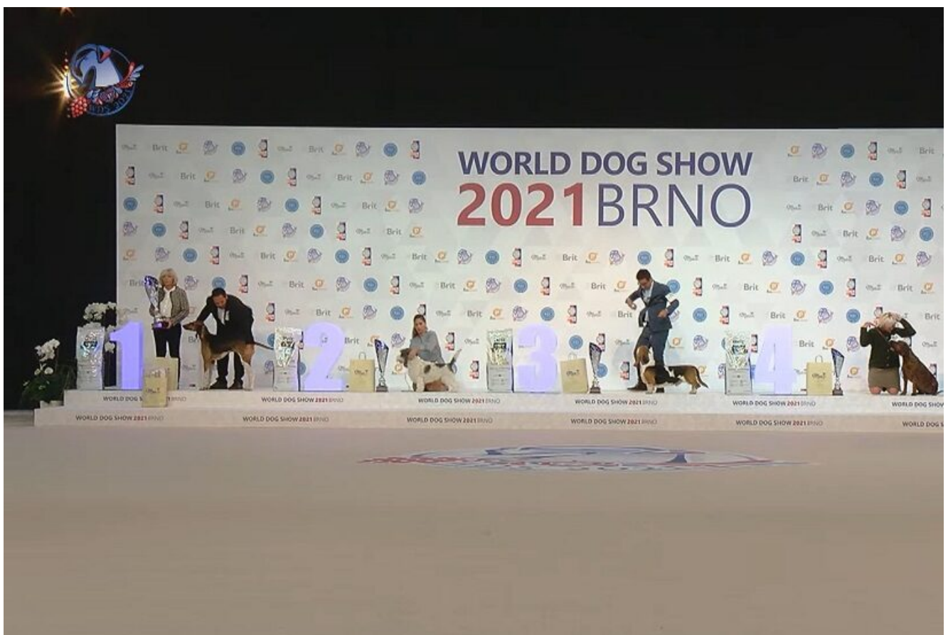
Un podio nel best in show del Campionato Mondiale 2021