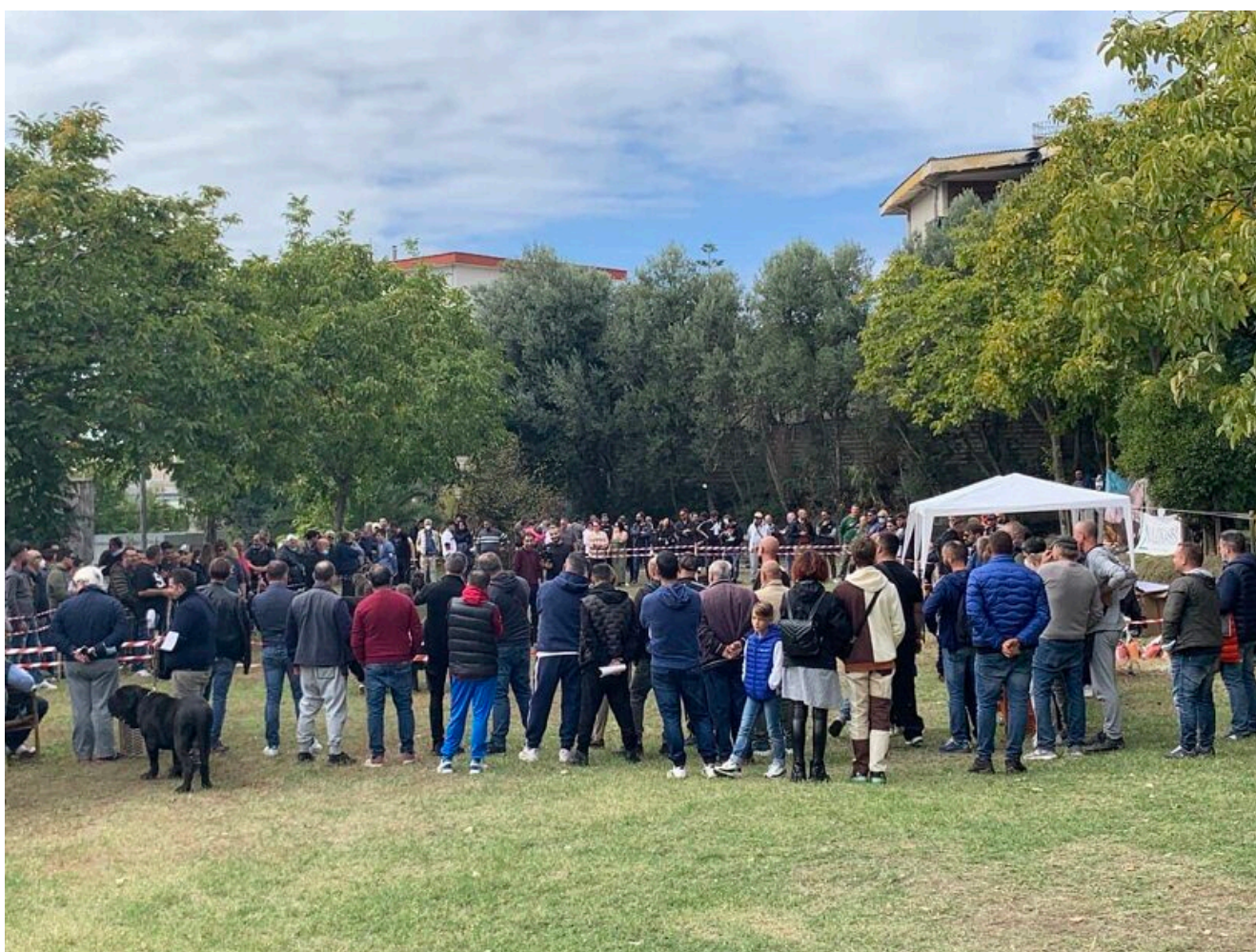
Il pubblico a bordo ring al Campionato A.T.I.MA.NA. di Pompei 2021

Noi allevatori, per troppi anni ammalati dalla partecipazione accanita alle verifiche zootecniche, ci siamo dovuti, gioco forza, "disintossicare" dalla mera competizione, e ci siamo concentrati sull'autentica e genuina attuazione dei nostri programmi, un po' destreggiandoci nella realtà, determinati progetti fin troppo tralasciati o accantonati per mancanza di tempo, un po' giocando con la nostra fantasia e fantasticando su come sarebbe stato il nostro "ritorno" in quel mondo di cui eravamo assuefatti e del quale pensavamo di non poter fare a meno. Perché si sa, noi allevatori siamo anche degli instancabili sognatori, talvolta con uno spirito agonistico estremamente accentuato, lo dobbiamo ammettere... pertanto, il pensiero fu: "mi raccomando non toglieteci le esposizioni!! ... altrimenti ci deprimiamo!" Ma come abbiamo visto, siamo sopravvissuti, abbiamo resistito, siamo tornati anche nei ring. Forse per la prima volta, in tanti, abbiamo compreso che le esposizioni non sono una primaria necessità, ma solo uno dei tanti metodi di confronto. Sì, è vero che sono importanti, ma ciò non toglie che essere stati tagliati fuori dai ring per più di un anno, non ha certo scalfito la nostra voglia di allevare.