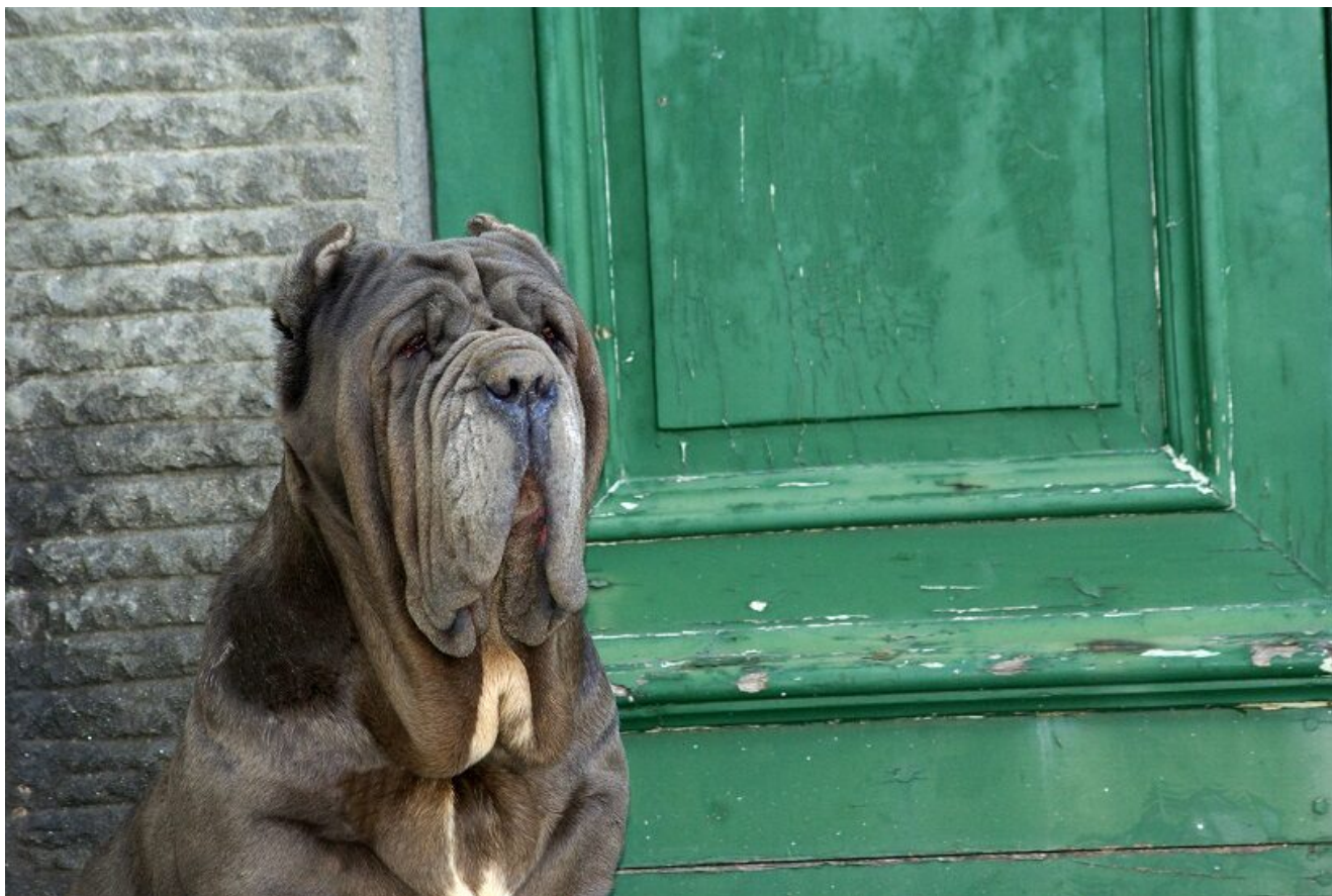
Femmina di Mastino Napoletano dinanzi al portone di casa

Proprio nel codice etico dell'E.N.C.I., regole di comportamento che tutti noi allevatori iscritti al registro ufficiale abbiamo firmato, al punto 3, è ben specificato, cito: "Impegnarsi ad approfondire le conoscenze sulla razza, sul suo standard morfologico, sulle problematiche sanitarie e sulle caratteristiche comportamentali e funzionali, in modo da interpretare correttamente gli obiettivi di selezione" .