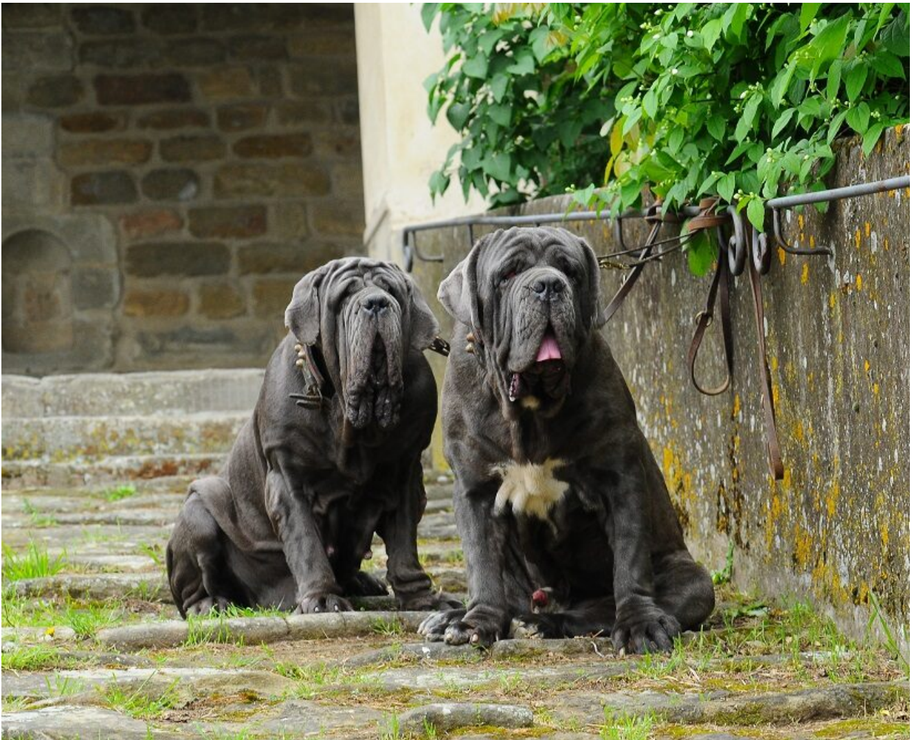
Coppia di Mastini Napoletani

Abbiamo quel Mastino Napoletano perfettamente equilibrato, che si adatta anche ad una vita di casa e che non mostrerà mai problematiche caratteriali, ma allo stesso tempo capitano soggetti non adatti a quel tipo di gestione, che presentano un innato temperamento "acceso" e una spiccata predisposizione alla territorialità. Mi viene subito in mente a tal proposito, tanto per far un esempio, un mio soggetto dei primi anni '90, " Olmo di Ponzano ", che in molti si ricorderanno per il suo forte carattere, che metteva a dura prova mio padre o chiunque lo avesse a guinzaglio; Olmo prendeva possesso del suo ambiente e non permetteva più a nessuno di avvicinarsi. Gestione sbagliata direte voi... No, era solo una predisposizione innata, che ogni tanto, in qualche soggetto, si manifesta più evidente rispetto ad altri.