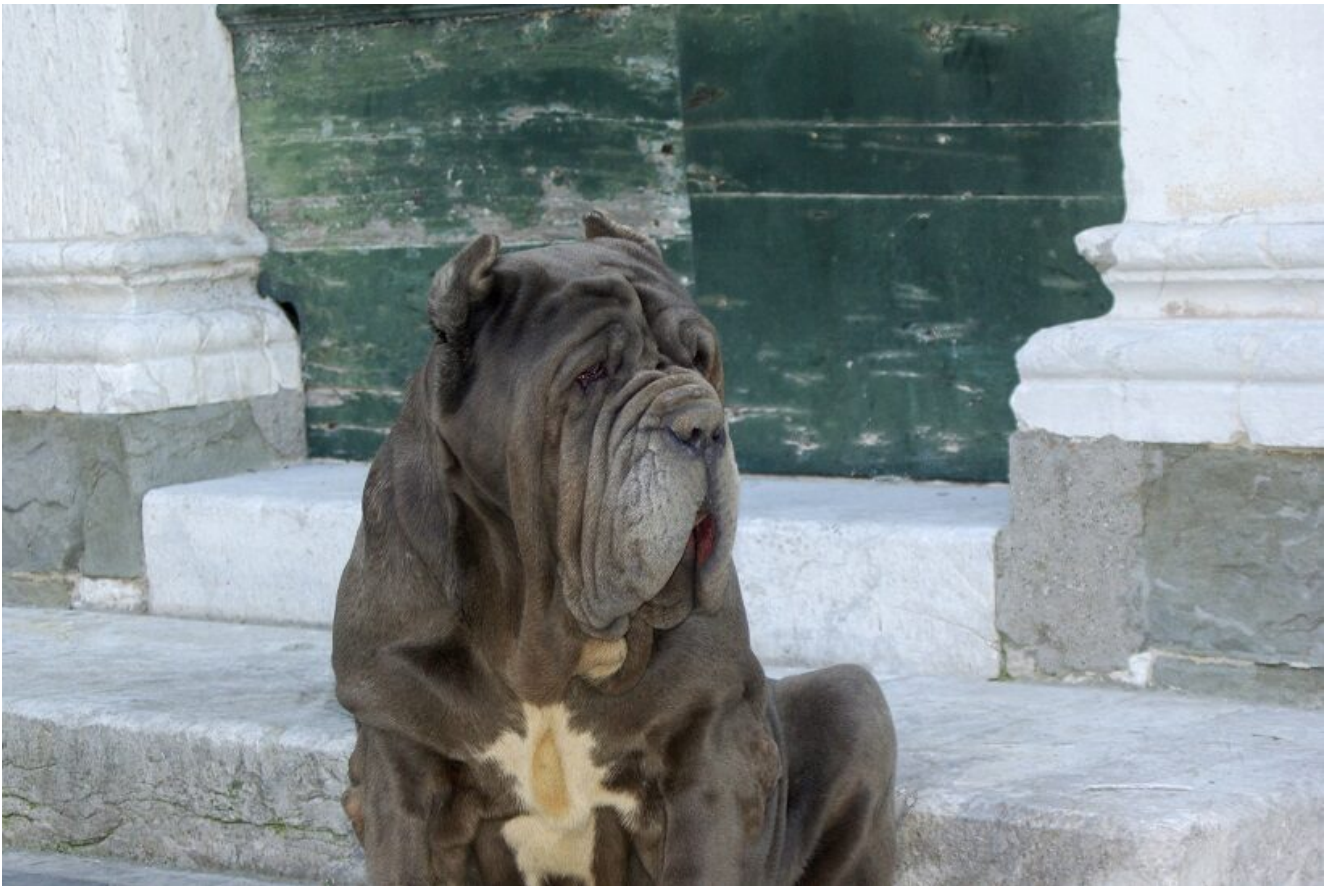
Una Mastina a guardia dell'entrata di casa - proprietà: All.to di Fossombrone

written by Rivista di Agraria.org | 2 aprile 2021 di Federico Vinattieri