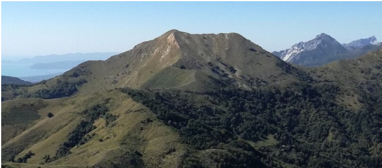
Monte Matanna (LU) 1317 msm , limite superiore artificiale del bosco