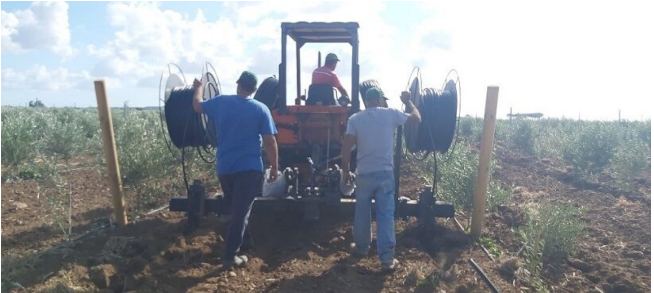
Installazione impianto in subirrigazione su Oliveto – Fonte Maniscalco Irrigazioni

Esistono esperienze di impianti in subirrigazione anche su asparago, erba medica e mais così come nel verde pubblico su tappeti erbosi. In quest'ultimo caso è consigliabile creare una "maglia" di irrigazione con ali gocciolanti ravvicinate e a spaziatura ridotta.