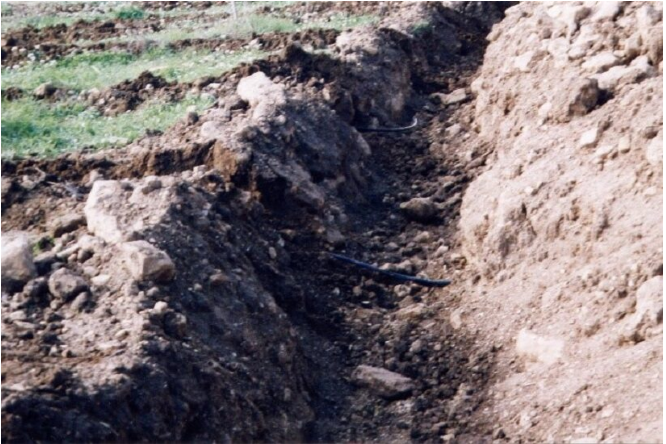
Scavo per controtestata di scarico da collegare alle ali gocciolanti interrate

Il sistema di subirrigazione garantisce un risparmio idrico misurabile intorno al 46 % rispetto a un normale sistema a goccia fuori terra: questo grazie alla mancanza di evaporazione dell'acqua di impianto oltre che all'assenza dell'effetto "deriva" causato dal vento.