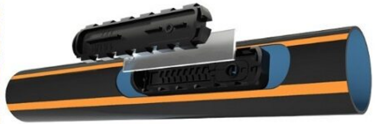
A sinistra, Protezione ROOTGUARD - Fonte Irritec - A destra, Ala gocciolante UNIRAM AS - Fonte NETAFIM

A prescindere dalla tipologia di materiale scelto i consigli tecnici sono sempre quelli di utilizzare un buon sistema di filtraggio centrale (con filtro a graniglia nel caso di acque provenienti da canali, laghi etc, idrocycloni-desabbiatori e filtri a rete se si tratta di acque da pozzo) e di filtri a dischi di settore. Altro accorgimento da adottare sarebbe quello di creare un circuito chiuso per ogni settore dell'impianto in modo da uniformare le pressioni di esercizio ed evitare di lasciare "aperte" le ali gocciolanti, pronte a scaricare su un collettore (controtestata) su cui è alloggiata, come già detto, una valvola di scarico nel punto più basso.