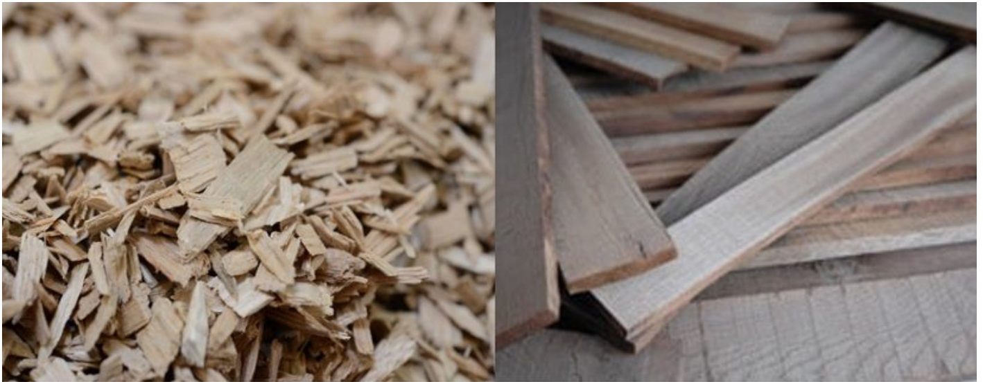
Chips (a sinistra) e staves (a destra)

Obiettivo specifico del presente articolo è occuparsi dell'impiego del legno in enologia, introducendo il lettore in un mondo con una lunga storia alle spalle ed in continua evoluzione, fino a giungere ai giorni nostri all'impiego del "legno nel vino", visto che attualmente il costo di botti e barriques aumenta considerevolmente il prezzo dei vini. Si stanno diffondendo sul mercato alcuni prodotti che si pongono come alternativa dei contenitori in legno, ci si riferisce in particolare all'utilizzo di legno di rovere sotto forma di frammenti legnosi, di diverse forme e dimensioni, e tostati più o meno intensamente. Chips (trucioli) e staves (doghe) sono le forme più comunemente conosciute, ammesse soltanto per vini italiani da tavola, ma anche sui vini IGP aggiungendoli in cisterna, come normato dal D.M. 21 giugno 2017 del MIPAAF e pubblicato sulla G.U. del 30 agosto 2017, per adeguarsi alla normativa comunitaria.