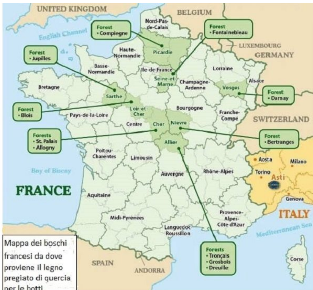
Mappa dei boschi di querce in Francia