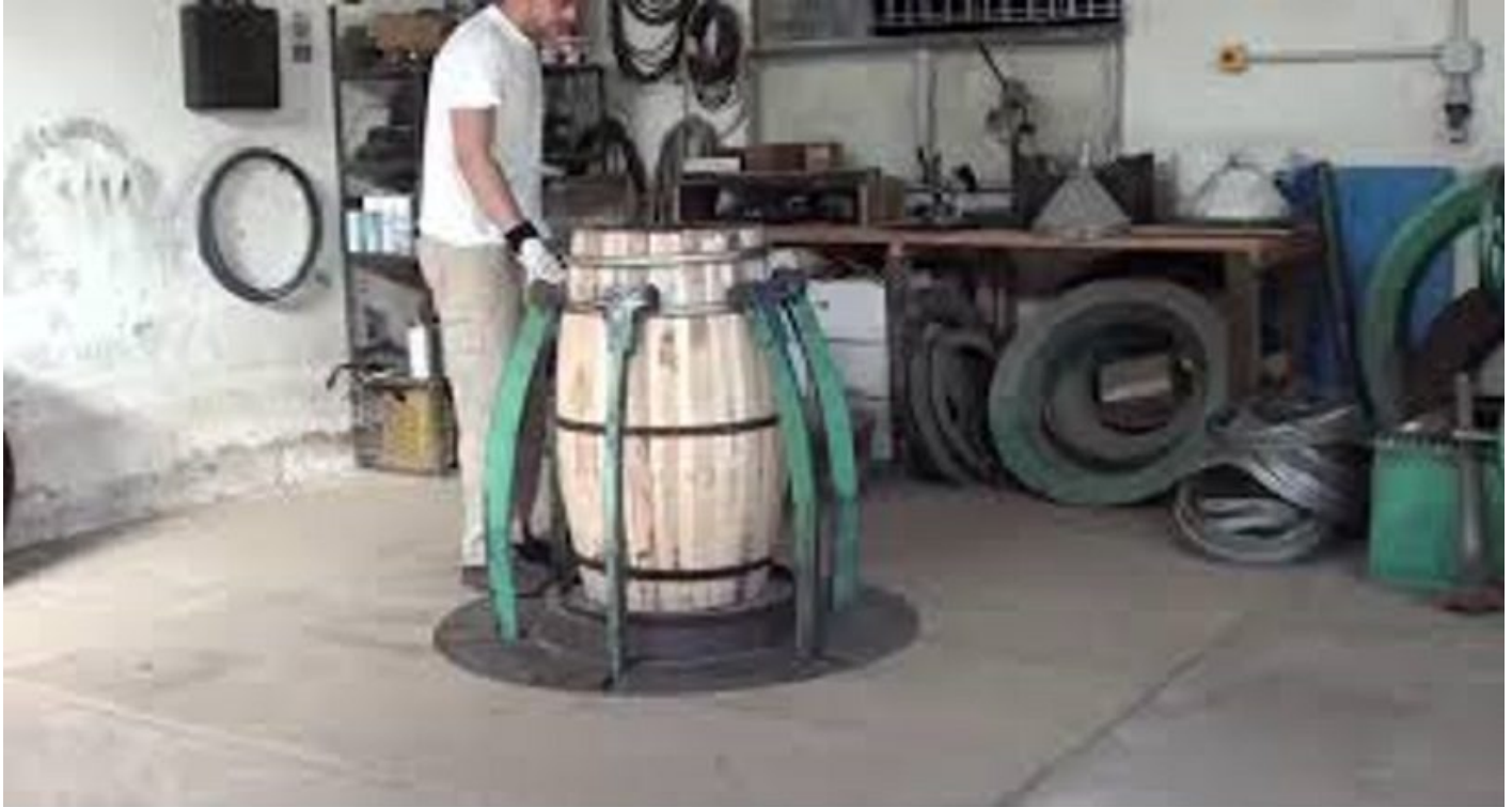
Assemblaggio della botte