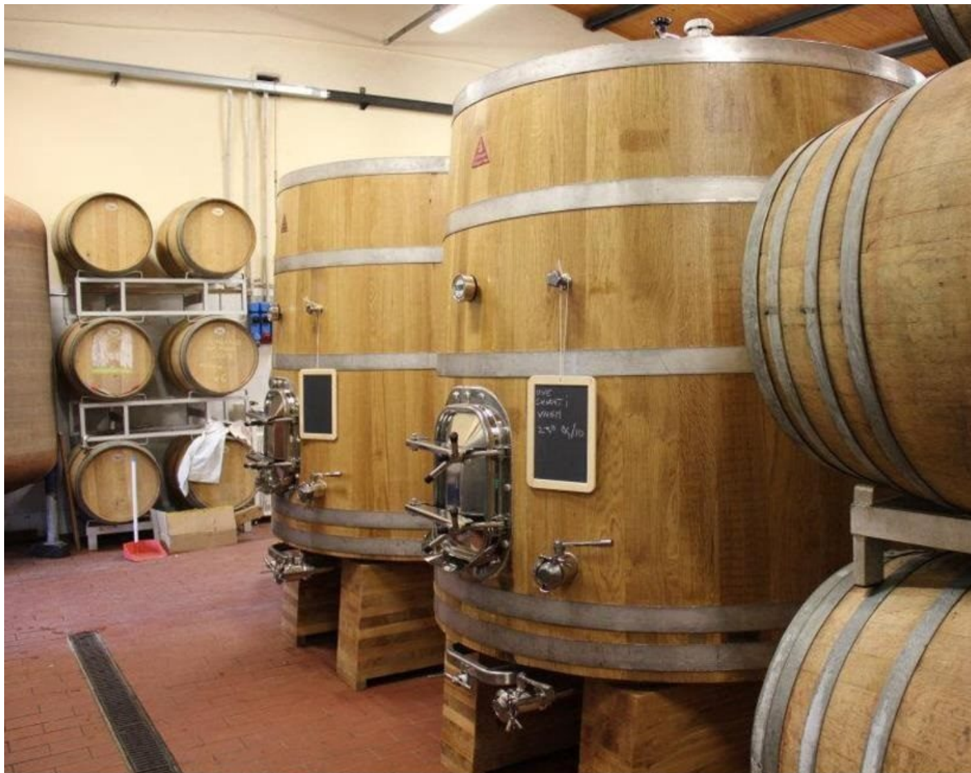
Tini in legno