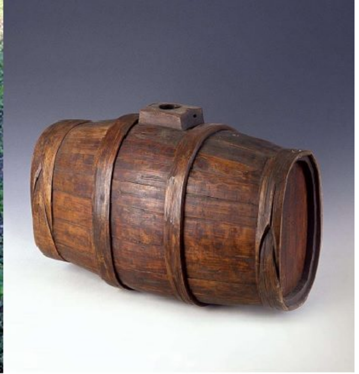
Bigoncia - Caratello

La lavorazione del legno per la realizzazione delle botti, dopo la scelta dello stesso, prevede il taglio delle doghe, ovvero le tavole di legno che, accostate, formeranno la botte; le doghe possono essere ricavate dai tronchi per «spacco» oppure per «seggiole». Nel primo caso le sezioni di tronco vengono spaccate con l'utilizzo di cunei idraulici che penetrano verticalmente nel tronco; le seggiole, invece, usate per le botti più grandi, vengono realizzate tagliando le tavole mediante sega a nastro; il materiale di scarto è decisamente inferiore rispetto allo spacco, a scapito però della resistenza meccanica; per ovviare a tali inconvenienti si provvede a incrementare lo spessore delle tavole, mai inferiore ai 35-40 mm, in funzione del volume del recipiente.