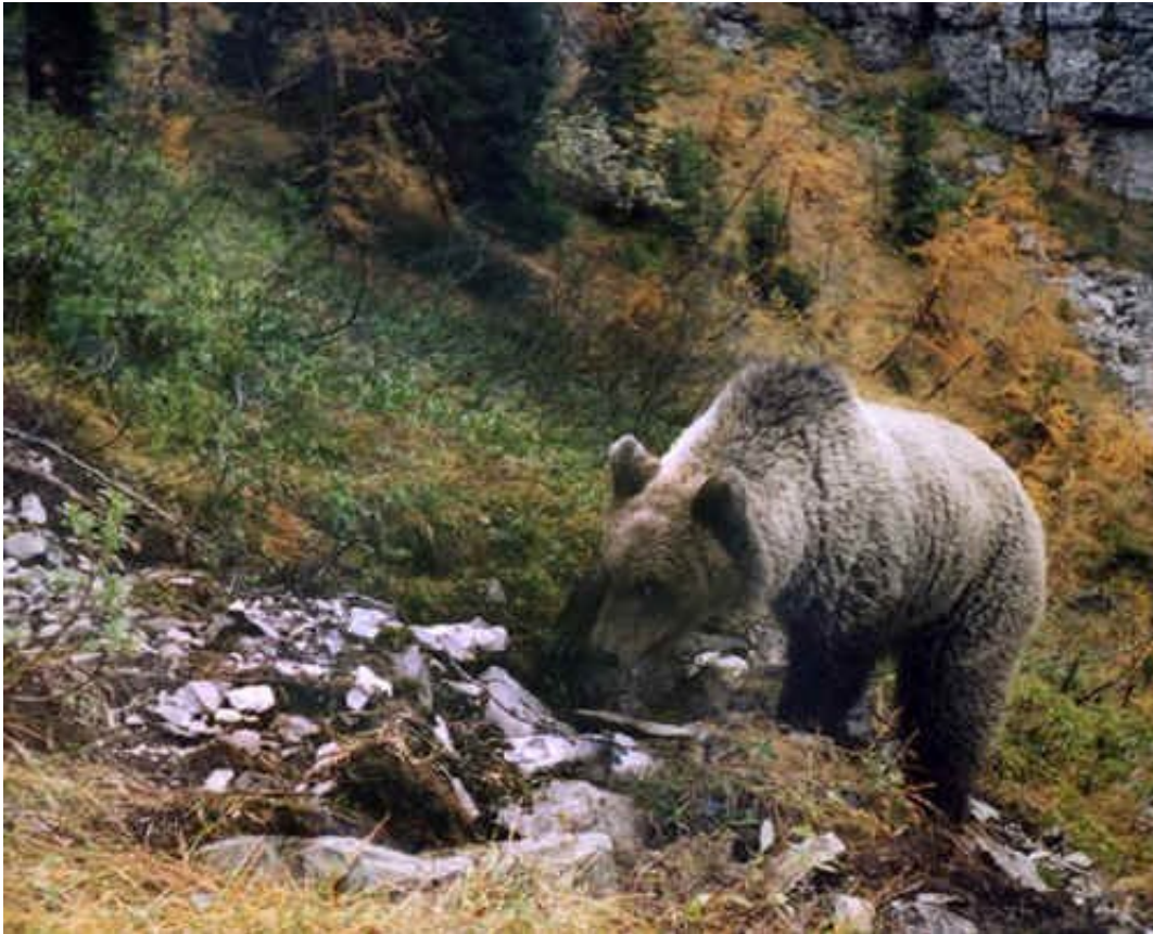
Un orso immortalato da una delle trappole fotografiche posizionate nel territorio del Parco, nei pressi della Val di Tovel

piccola esca alimentare - costituita da mais e miele - ed una odorosa, ma senza dispositivi di cattura.